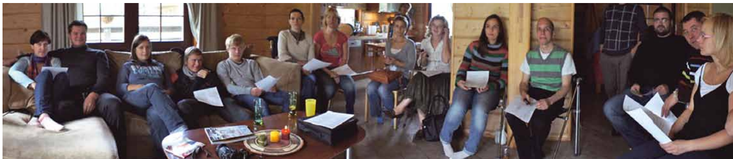
Garkalnes draudzes dievkalpojums.

Pirms diviem gadiem Dievs aicināja mūsu ģimeni sākt jaunu draudzi vietā, kur dzīvojam. Mēs ar sievu dzīvojam Ādažos jau piecus gadus. Kad sākām tur dzīvot, pamanījām, ka mūsu apkārtnē nav gandrīz nevienas draudzes. Mēs pat bijām pārliecināti, ka mūsu rajonā nav nevienas kristieša, izņemot mūs. Laikam ejot, mēs sajūtām pamudinājumu, ka Dievs vēlas redzēt kristīgu sadraudzību vietā, kur dzīvojam.