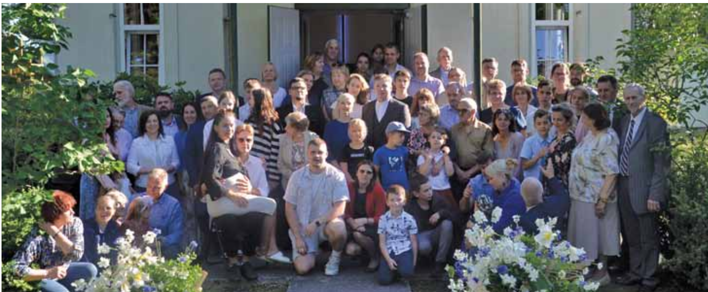
Svētku dievkalpojuma dalībnieki