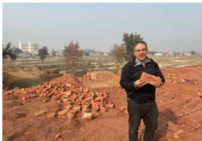
Trīs gadu laikā viena vergu ģimene izgatavo vienu miljonu ķieģeļu. Tālumā sagatavotie ķieģeļi tikai saulē sakalstuši. Man rokās ceplī apdedzināts ķieģelis.

augšu, tādēļ viņi verdzībā nonāk parādu dēļ. Vairumā gadījumos tas notiek, kad ģimenē ir medicīniska krīze un nepieciešama ārstēšanās slimnīcā. Naudu labprāt aizdod trīs biznesa jomu pārstāvji. Paklāju ražotāji, lielleuksaimnieki un ķieģeļu ražotāji, jo viņiem vienmēr nepieciešamas darba rokas. Nespējot atmaksāt parādu, ģimene kļūst par vergiem. Nav tā, ka katra darba diena tiek skaitīta kā daļa no parāda atmaksas un laika gaitā parāds tiek nolīdzināts. Vergiem jāstrādā par vēdera un istabas tiesu tik ilgi, kamēr parāds tiek dzēsts. Bet kā dzēst parādu, ja nevari nopelnīt naudu tā dzēšanai, jo visu laiku tev jāstrādā par vēdera tiesu? Mūsu izpirktās ģimenes bija vergi jau trešajā paaudzē. Mēs viņus izglābām no bezcerības.