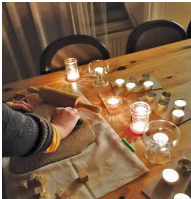
“Podnieka namā” dalībnieces darbojas sveču gaismā.