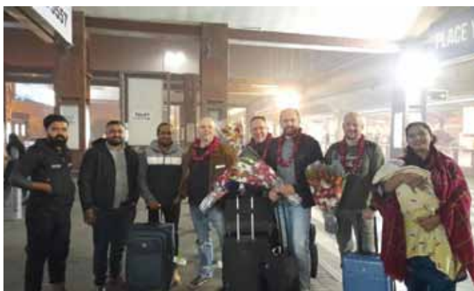
Pakistānā viesus visur sagaida ar lieliem ziedu pušķiem. Arī lidostā.