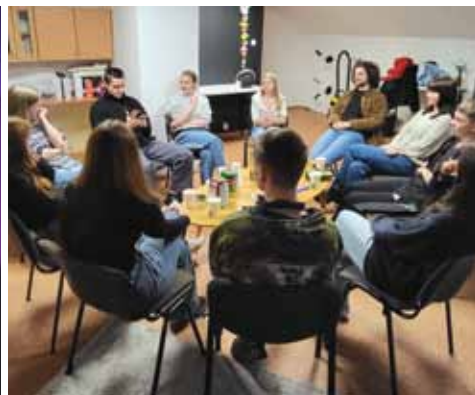
Jauniešu Bībeles studija draudzē “Vieta”.

Vēstulē efeziešiem 4:11-12 raksta: “Viņš arī devis citus par apustuļiem, citus par praviešiem, citus par evaņģēlistiem, citus par ganiem un mācītājiem, lai svētos sagatavotu kalpošanas darbam, Kristus miesai par stiprinājumu.” Manuprāt, šis ir draudzes galvenais uzdevums – sagatavot svētos kalpošanas darbam Kristus miesai (draudzei) par stiprinājumu. Un radīt šo mācekļības procesu interesantu arī jauniem cilvēkiem, nezaudējot pašu galveno – Bībeles pamatu.