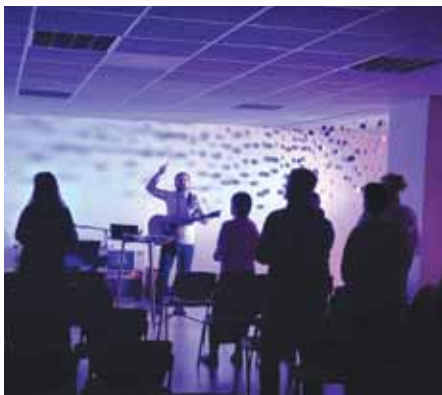
Draudzes pielūgsmes vakarā.