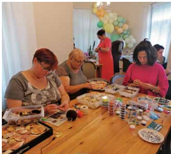
Gatavojot rotaslietas no gliemežvākiem un pērlītēm, notiek “Saruna ar Dievu”.