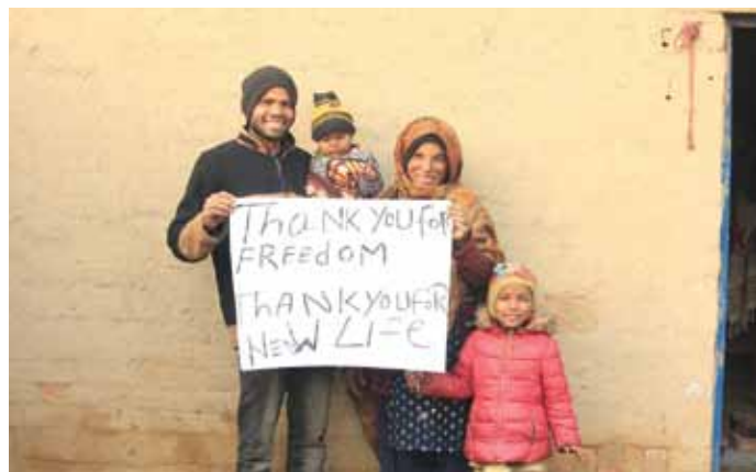
Paldies par brīvību. Paldies par jaunu dzīvi.

Decembra misijas laikā mēs visi četri likām kopā ziedotos līdzekļus un varējām izpirkt trīs ģimenes no verdzības un iegādāties viņām moto rikšas, lai ģimenes varētu sākt pelnīt iztiku ar savu darbu. Paldies visiem, kas mums uzticējāties! Mēs bijām jūsu svētības un labvēlības nesēji šīm ģimenēm. Šobrīd, raksta rakstīšanas brīdī, izpirkšanu gaida vēl divas ģimenes. Līdz janvāra beigām izpirkšana jau būs notikusi. Manuprāt, tas ir pārsteidzoši, ka divu mēnešu laikā latvieši būs izpirkuši brīvībai piecas kristiešu ģimenes no verdzības Pakistānā.