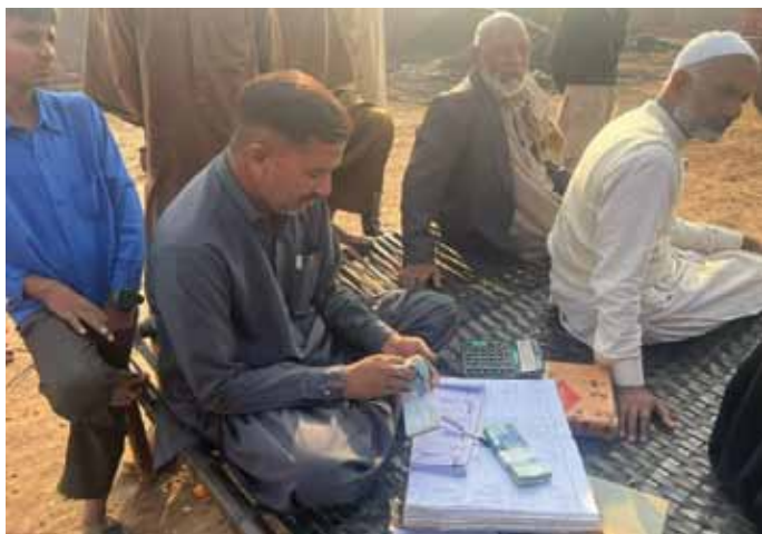
Ķieģeļu cepļa īpašnieka pārstāvis skaita izpirkuma naudu.

saražoto ķieģeļu vērtība jau pirmo sešu mēnešu laikā pārsniedz parāda summu, bet daudzi spiesti turpināt vergot daudzās paaudzēs. Kaut šāda paverdzināšana nav saskaņā ar valsts likumiem, tomēr sabiedrības dominējošajiem slāņiem tā ir izdevīga, tāpēc tā joprojām notiek.