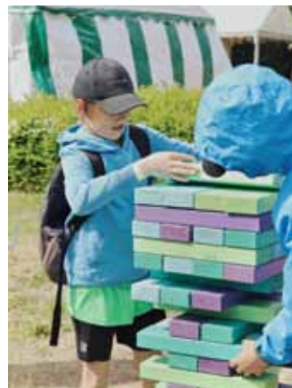
Vairāki desmiti spēļu un radošo darbnīcu, kurās dalībnieki krāja uzlīmes, lai pie laimes rata tās pārvērstu gardos našķos.