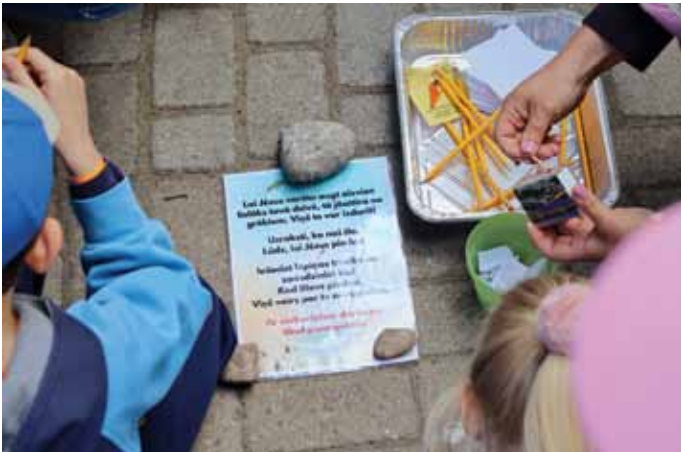
Lūgšanu stacijas – vietas, kur pārdomāt, aizlūgt, slavēt, nožēlot un pateikties.