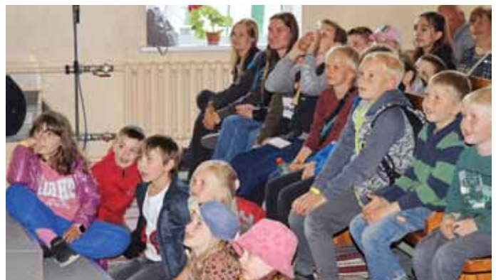
Pēc garās un papildītās dienas bērnu uzmanība nemazinājās ne uz brīdi.