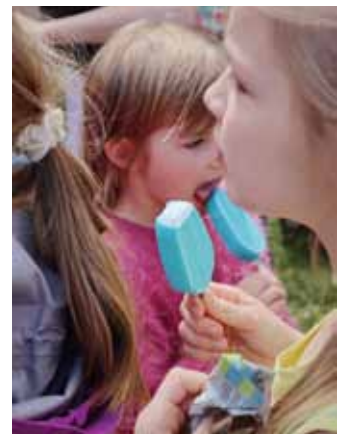
Saldējums “Zili brīnumi” ir patiešām garšs, un tas labi iederējās šajā brīnumainajā dienā!