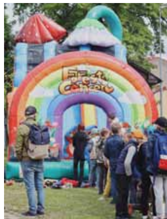
Lēkjamās atrakcijas un radošo darbnīcu teltis darbu turpināja pat pusdienu pārtraukumā.