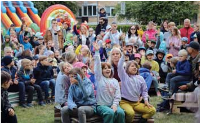
Jelgavas draudzes pagalmu papildīja bērni no visiem Latvijas novadiem.