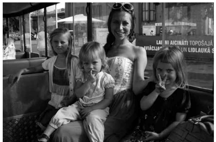
Belliņa kopā ar mammu un māsiņām

Belliņa mums bija otrais bērns ģimenē. Gadījās, ka Belliņa dažreiz no vecākās māsu tika pastumta malā, jo viņa bija mazāka, vēl tik daudz nevarēja un neprata. Tad reizēm viņai ļoti sāpēja sirds, viņa sāka raudāt un es viņai sacīju: "Zini, tu esi otrā, es un arī tava mamma esam otrie bērni ģimenē un "otrais" var parādīt ar pirkstiem kā "V", kas nozīmē arī "victory" (angļu val. "uzvara"). Mēs esam otrie, un mēs esam uzvarētāji." Tas bija mūsu noslēpums. Kad Belliņa nomira, es par šo mūsu noslēpumu pastāstīju pārējiem. Mēs skatījāmies bildes, un daudzās no tām mēs pamanījām, ka Belliņa rāda "V" zīmi. Šī ir pēdējā bilde ar Belliņas uzvaras zīmi, kas tapa Rīgas svētkos, nedēļu pirms viņas aiziešanas.