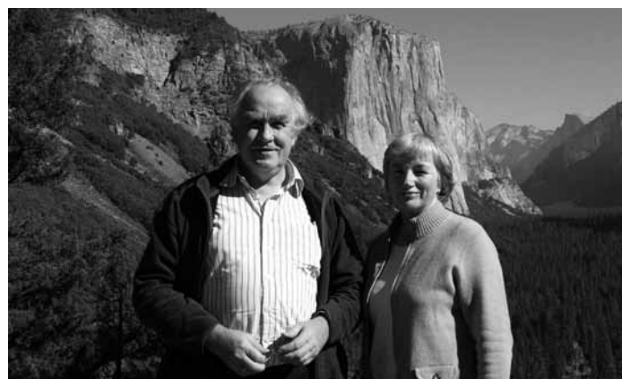
I. Hiršs ar dzīvesbiedri

Ja runājam par cilvēciskām vājībām, tad man ļoti patīk braukt ar mašīnu. Ja varētu, ļoti labprāt sēstos un brauktu riņķī ap