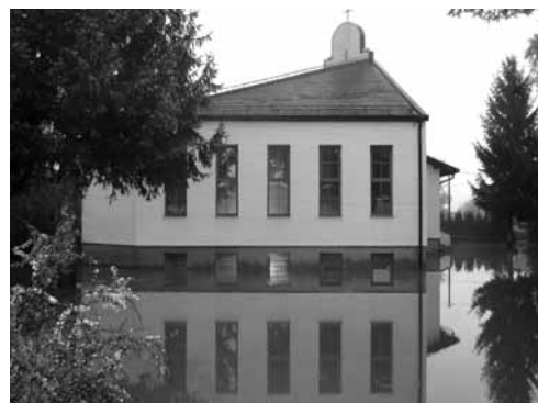
Plūdus cietušais Puscines ciema dievnams