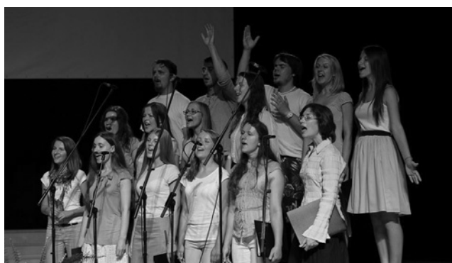
“Kora darbnīcas” koris