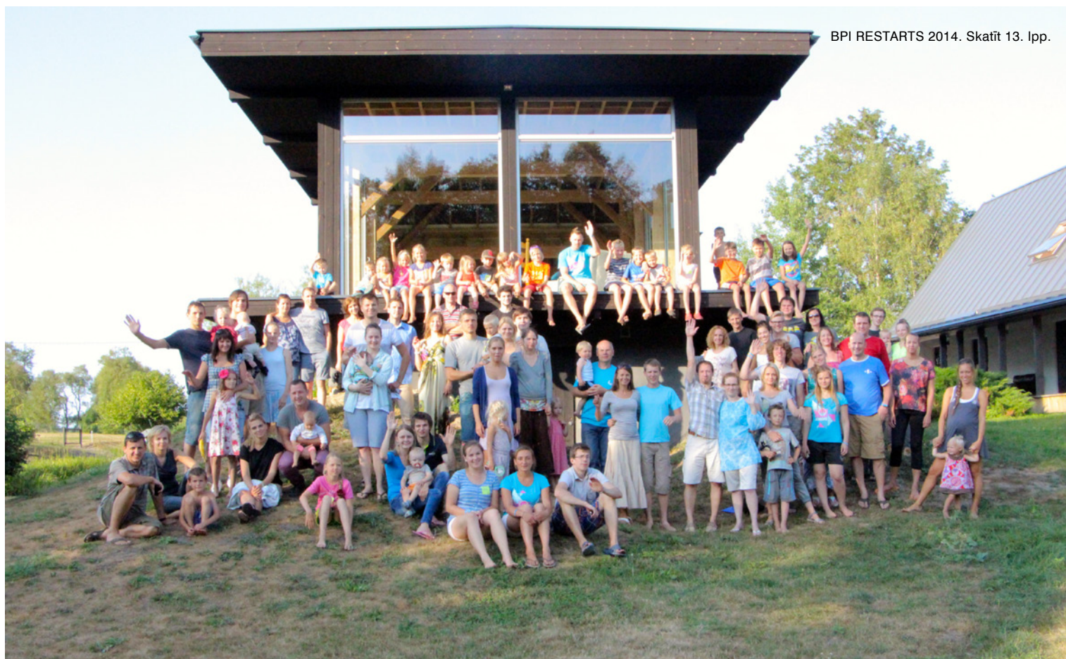
BPI RESTARTS 2014. Skatīt 13. lpp.

Pieteikšanās: līdz 10. septembrim LBDS Kancelejā (mob. 20390979, tālr. 67223379, epasts: kanceleja@lbds.lv )