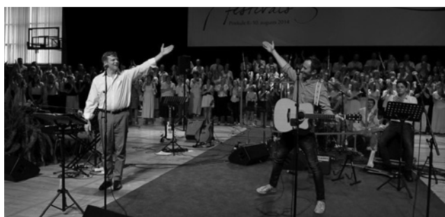
Komponists Ēriks Ešenvalds un mūziķim Renāram Kauperam