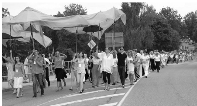
“Ticības spārni” svētku gājienā