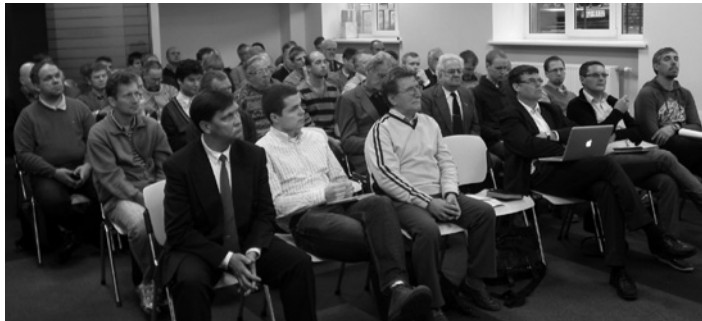
Garīdznieku Brālības konferences dalībnieki