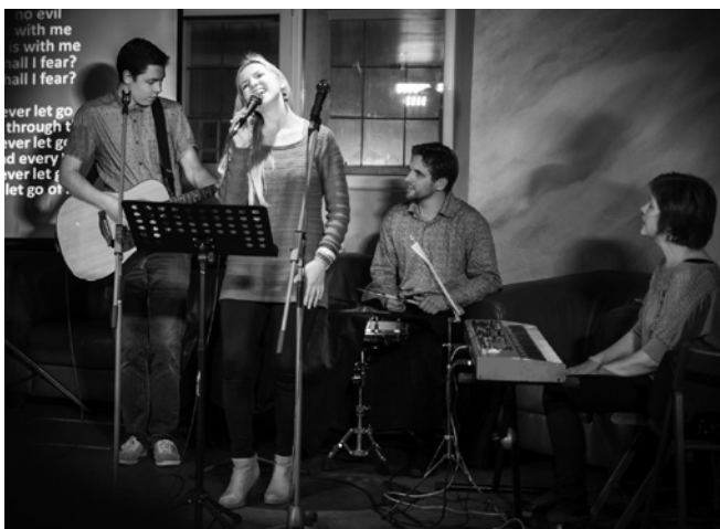
Konferences pielūgsmes grupa.

Pēdējā konferences dienā kopā ar LBDS bīskapu Pēteri Sproģi domājām par zemāko punktu ticības dzīvē – "dvēseles nakti", "tuksnesi", "nāves ieleju" – kad šaubas, bailes un dusmas ir klātesošas,