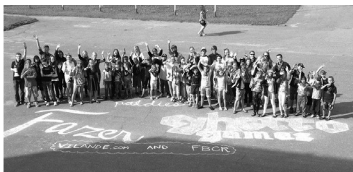
Bērnu nometnes dalībnieki Maskavas Dārzā Rīgā

Esmu Dievam no sirds pateicīga par Vīlandes draudzi, kas ir tik ļoti atvērta darbam ar šiem bērniem. Jaunieši ir gatavi darīt jebko – gatavot ēst, sagatavot pārtikas pakas ģimenēm, izvadāt pēc tam bērnus pa mājām, samīļot, sakārtot dokumentus. Mums nav problēmu – ir tikai izaicinājumi.