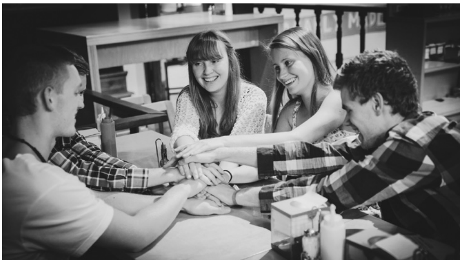
Konferences dalībnieki.

Kopā ar Paulu Donderu divu dienu garumā pārdomājām katrs savu dzīves