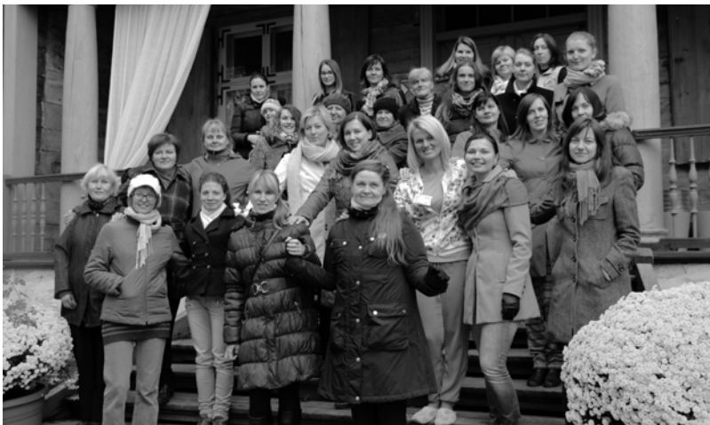
Nometnes dalībnieki.

Ja Tev būtu iespēja lūgt Jēzum iemācīt Tev vienu lietu, ko Tu lūgtu? Mācekļiem, esot kopā ik dienas ar Jēzu, bija iespēja pajautāt jebko, tomēr viņi lūdza tikai vienu lietu – “Kungs, māci mums Dievu lūgt.” (Lūkas ev. 11:1) Šim lūgumam pievienojoties, 17.-19. oktobrī svētdienskolotāji pulcējās Rāmavas muižā uz Rudens mācību-atpūtas nometni “Māci mūs.” Par piedzīvoto tur stāsta izvilkumi no nometnes dalībnieku rakstītās nometnes dienasgrāmatas.