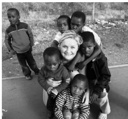
Kalpojot Dienvidāfrikā vietā, ko sauc "Cerību Zeme"

Pirms trīs gadiem, kad jau otro reizi biju Āfrikā, mēs daudz strādājām ar ielu bērniem, ļoti trūcīgiem un slimiem bērniņiem, arī ar jauniešiem. Tā es vēl vairāk iemīlēju šo kontinentu un cilvēkus – jutos tur kā mājās. Kad mans misijas laiks gāja uz beigām, teicu Dievam – ja Tu gribi, lai es te palieku, tad es ar vislielāko prieku to