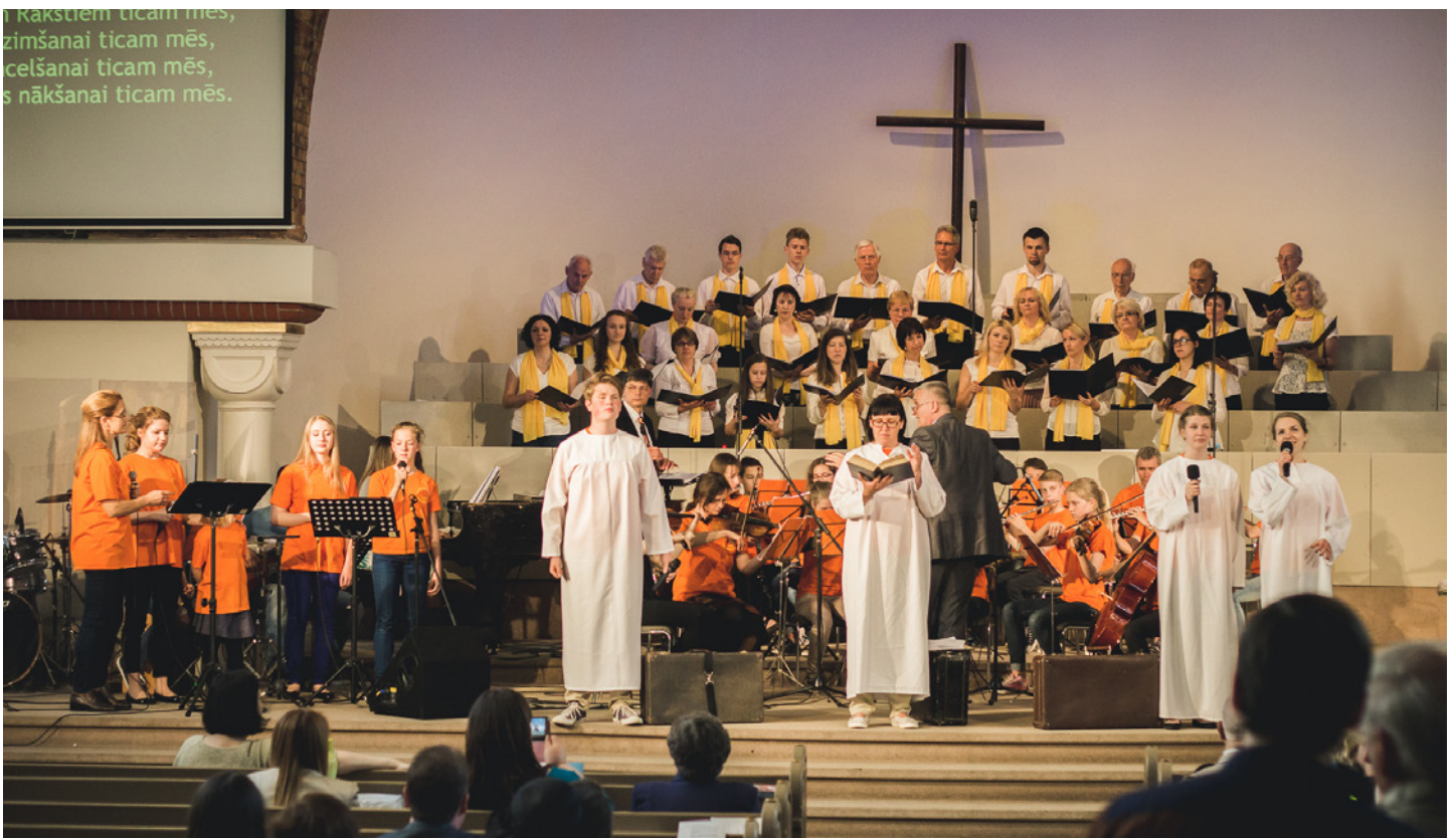
Muzikāli dramatisks vēstījums "Baptisti"

Bīskapa Pēteru Sproģu uzrunas Kongresā video ieraksts LBDS mājas lapā www.lbds.lv