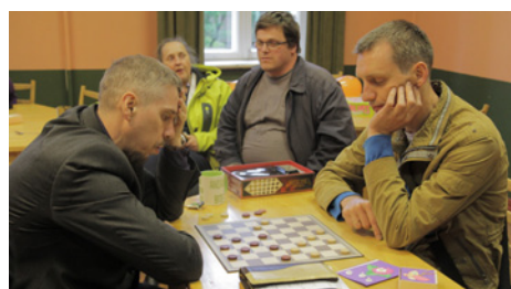
Dambrete ar mācītāju – pretinieki gaida savu kārtu.

pirmo reizi, tādēļ bija grūti paredzēt, kā vakars izvērtīsies un kāda būs cilvēku atsaucība. Dievs patiesi svētīja šo vakaru, un interese par mūsu draudzi bija – vakara gaitā draudzē paviesojās vairāk kā 100