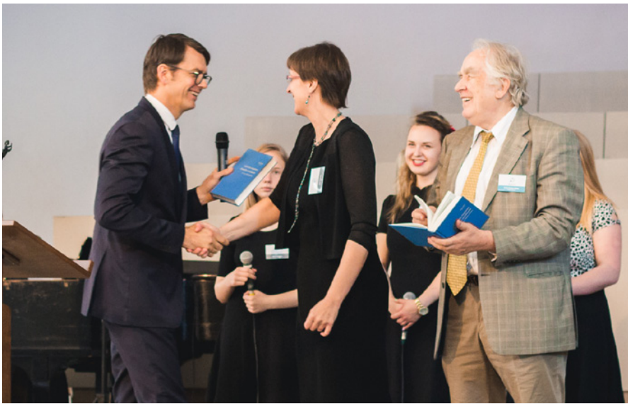
Jāņa Rīsa sastādītās grāmatas "Latviešu baptistu draudžu izcelšanās un viņu tālākā attīstība" (1913) atjaunotā izdevuma prezentācija