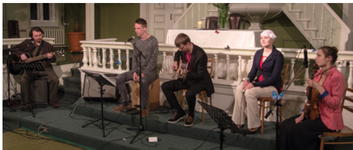
Ciānas jauno mūziķu orģināldziesmu koncerts.

Šī gada 10. jūnijā, Baznīcu naktī, ikvienam interesentam bija iespēja paviesoties arī Liepājas Ciānas draudzē, kuras durvis bija atvērtas no plkst. 18:00 līdz 24:00. Baznīcu naktī piedalījāmies