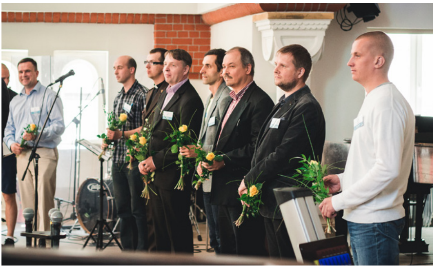
LBDS jauno garīdznieku sveikšana