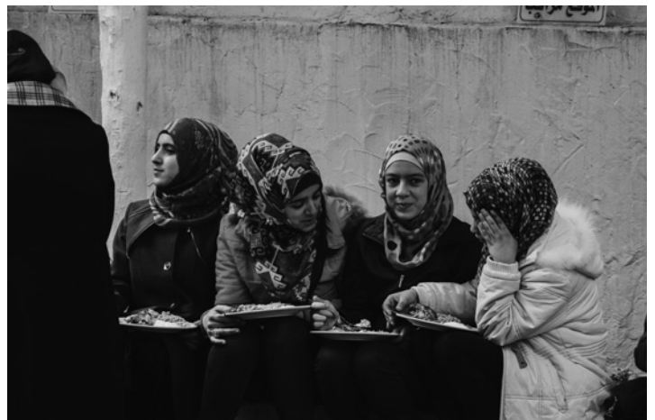
Silta maltīte bēgļiem