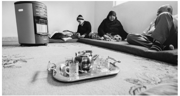
Pie sīriešu bēgļiem mājās

Mums bija arī vairākas tikšanās ar vietējo konfesiju līderiem. Ļoti