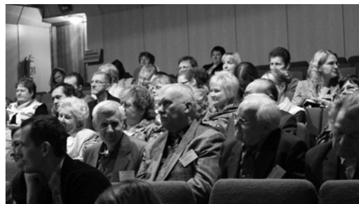
Reģionālās tikšanās dalībnieki Viesītē

Pēc pārdomu un diskusiju laika katrs dalībnieks devās uz savas kalpošanas nozares darba grupu, kur tika pārrunātas konkrētās kalpošanas aktualitātes. Tā nemanāmi pienāca vakara stunda, kas mudināja atbraucējus posties mājupceļā. Smails un labie vārdi liecināja, ka tikšanās bijusi