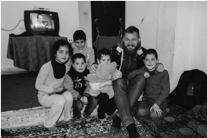
Toms ciemojas sīriešu ģimenē

Pirmā vizīte ir kādā sīriešu ģimenē. Mūs aicina iekšā dzīvoklī. Pamanu uzkrītošo minimālismu.