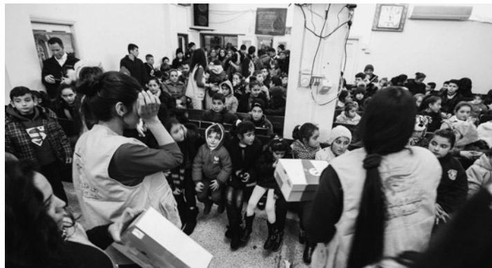
Pirmās 250 dāvanas saņem irākiešu bēgļu bērni

no ierastā. Ielidojot Izraēlas gaisa telpā, visiem pasažieriem bija jāpaliek savās sēdvietās un bija aizliegts kabīnē pārvietoties. Pa iluminatoru tūlumā varējām