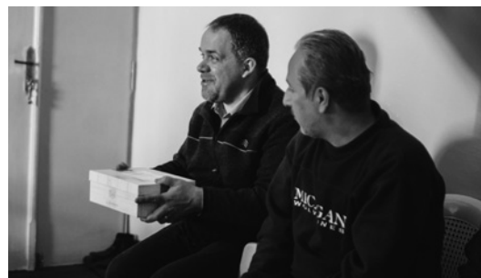
Irākiešu ģimenē ar „Zvaigzne austrumos” dāvanām

sejām, taču to uztveru arī kā metaforu tam, ka man vēl jāiepazīst jaunā vide, kultūra, situācija. To varēšu vien ar vietējo cilvēku palīdzību. Jozefs man pastāsta, ka bēgļi nāk no divām vietām. Sīrieši pārsvarā ir musulmaņi, kas jau pāris gadus bēg prom no Sirijas pilsoņu kara dēļ. Daudzi zaudējuši savas dzīves vietas bombardēšanas dēļ. Pagājušajā gadā Jordānijā sāka iepļūst daudzi irākiešu bēgļi. Viņi pārsvarā ir kristieši, kas bēg reliģiskā genocīda dēļ, ko pret kristiešiem un citām minoritātēm organizē Islama Valsts kaujinieki. Jordānijā bēgļiem nav atļauts strādāt. ANO katram oficiāli reģistrētam bēglim katru mēnesi piešķir pārtikas talonus 50 dināru vērtībā, ko bieži vien viņi spiesti pārdot, lai iegūtu naudu dzīves vietas īrei. Bēgļu bērni skolās neiet, tāpēc visu dienu pavada mājās. Gan jordanieši, gan sīrieši, gan arī irākieši komunicē arābu valodā, taču tas nenozīmē, ka jordanieši būtu priecīgi par tik lielu bēgļu pieplūdumu. Bēgļi ir ļoti priecīgi un pateicīgi par palīdzību, ko viņi šajā draudzē saņem. Šeit viņiem pieejams zobārsts, frizieris, bērnu centrs. Šeit bēgļiem māca radīt dažādus suvenīrus, kādus tirgo tūristu populārākajās vietās. Šeit notiek semināri un apmācība sievietēm, lai palīdzētu ģimenēm vardarbības gadījumos. Šeit pieejams arī