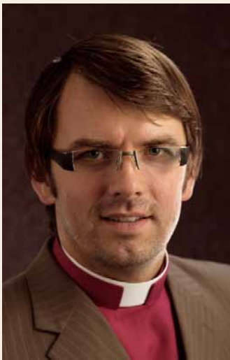
LBDS bīskaps Pēteris Sproģis