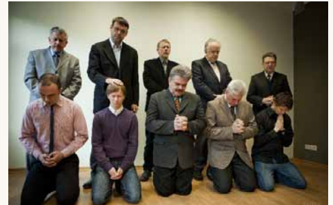
Aizlūgšanas par BPI 2010. gada iesaukuma studentiem

Lūdziet par jaunajiem studentiem to, ko Pāvils raksta efeziešiem 3:14-19: “Tādēļ es loku savus ceļus Tēva priekšā, no kā ikviena cilts debesīs un virs zemes dabū savu vārdu, lai Viņš Savā godības bagātībā jums dotu Savu Garu un darītu stipru jūsu iekšējo cilvēku un lai Kristus, jums ticību turot, mājotu jūsu sirdis, un jūs iesakņotos un stipri stāvētu mīlestībā, ka līdz ar visiem svētajiem jūs spētu aptvert, kāds ir platums, garums, augstums un dziļums, un izprastu Kristus mīlestību, kas ir daudz pārāka par katru atziņu, un, ar to piepildīti, iegūtu visu Dieva pilnību.”