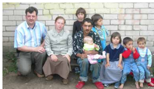
Mācītājs kopā ar kādu ģimeni Krāslavā

Latgale ir viens no četriem Latvijas kultūrvēsturiskajiem novadiem, kurš atrodas austrumu daļā, Daugavas ziemeļu pusē. Lai gan vēsturiski dominējošā konfesija Latvijā ir luterānisms, Latgalē ir vērojamas senās Romas katoļu baznīcas saknes. Etniski novada lielāko iedzīvotāju daļu veido krievu tautības