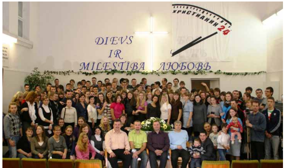
Daugavpils draudze “Baltā baznīca”