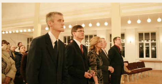
Pestīšanas Tempļa draudze