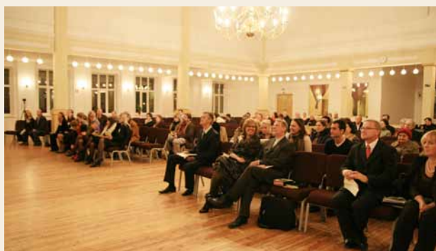
Pestīšanas Tempļa draudze kopā ar svētku viesiem