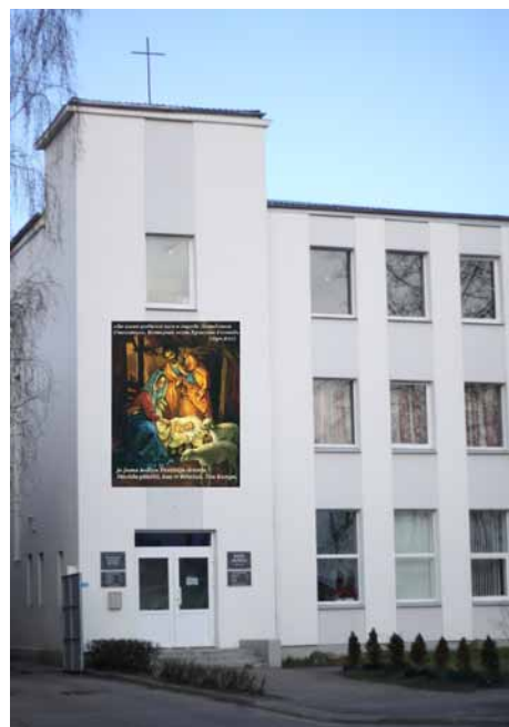
Daugavpils draudze "Baltā baznīca"

Manuprāt, pats galvenais ir sasniegt trīs mērķus: 1) orientēt draudzi uz Evaņģēlija