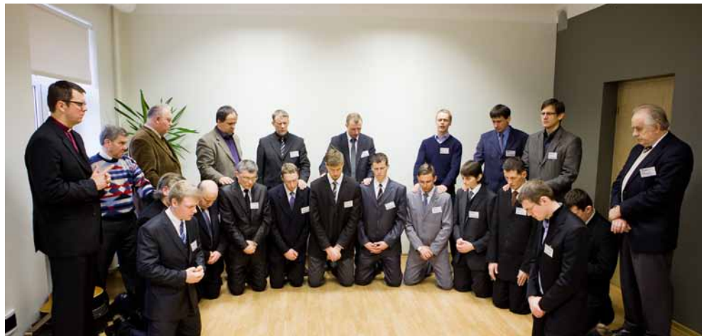
Aizlūgums par BPI jaunajiem studentiem