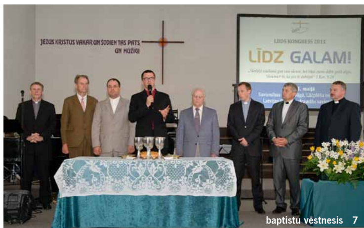
Paplašinātu LBDS Kongresa 2011 bilžu galeriju var apskatīties LBDS mājas lapā www.lbds.lv