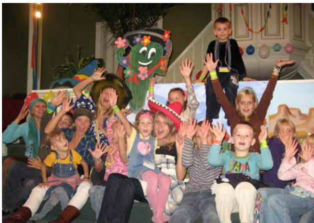
Vasaras Bībeles skola

kurai mums finanses pietrūka. Bieži mēs strādājam nākotnei, pie perspektīvām lietām. Bet ir kāda perspektīva, kas sagaida mūs visus – tās ir sirmas galvas, kad paliek nedaudz grūtāk dzirdēt. Mūsu draudzē ir ļoti veca skaņu aparātūra. Mēs būtu ļoti pateicīgi par atbalstu, lai mēs varētu iegādāties kvalitatīvāku aparātūru, kā arī izveidot sistēmu, lai seniori, kuriem tas nepieciešams, varētu sprediķi klausīties austiņās. Īpaši mēs lūgtu bijušos draudzes locekļus – jūsu atbalsts būtu aizkustinošs.