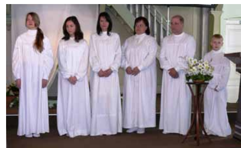
2011. gada kristības

kuros jaunās māmiņas var dalīties pieredzē, liecināt par piedzīvoto, kopt kristīgu sadraudzību. Tāpat notiek pāru vakari,