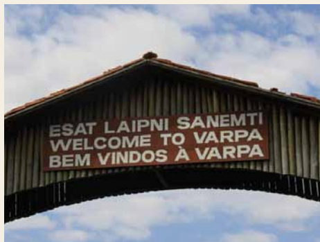
Aizrunāta kolonija Vārpa – 5000 ha mūža mežu

Šo vietu vēsture ir interesanta. 19. gadsimta 90. gados ap 300 latviešu devās uz tolaik neattīstīto Brazīliju, jo tur varēja dabūt zemi uz izpirkšanu. Cilvēks varēja atbraukt nabags, sākt izcirst mežu un iekopt zemi, izpirkt to un iegūt savā īpašumā. Baptisti arī bija šo cilvēku vidū. Otrs vilnis bija 20. gadsimta 20. gados, kad uz Brazīliju devās vairāk nekā 2000 latviešu baptistu. Šoreiz motivācija bija pretrunīgi vērtējama. Kādiem bija atklāsme, ka tuvojās sarkanais pūķis, tāpēc jādodas prom. Pēc gadiem izrādījās, ka tā bija taisnība. Bija arī daļa neveselīgas un maldīgas motivācijas, jo kādi sludināja, ka būs pasaules gals, tāpēc jābrauc uz Brazīliju. Cilvēki mēnesi ceļoja pāri okeānam uz Brazīliju, tad ar vilcienu un vērsu pajūgiem pa sauszemi, kur bija aizrunāta kolonija Vārpa – 5000 ha mūža mežu. Tas ir apbrīnojami, jo cilvēki devās uz nezināmo, pirms tam neko par to nelasot un negūglējot .