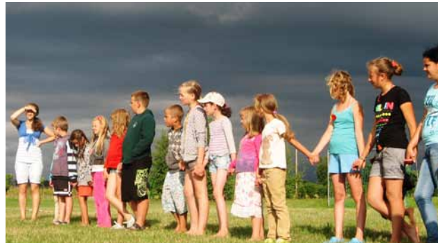
Vasaras Bībeles skola

Saprotot, ka draudzes uzdevums ir būt par gaismu savā apkārtnē un nest Labo Vēsti uz ārieni – tiem, kas vēl nav piedzīvojuši Dieva mīlestību un vadību savā ikdienā, Ventspils draudze cenšas nenoslēgties tikai savās baznīcas sienās, bet pildīt Kristus doto uzdevumu un aizsniegt cilvēkus ārpusē. Katru mēnesi dievkalpojums, kurā piedalās arī dziedātāji, notiek pilsētas pansionātā. Māsu pulciņa pārstāves un arī citi draudzes locekļi apmeklē slimnīcas paliatīvās aprūpes nodaļu, lai liecinātu par Dievu slimniekiem un viņu piederīgajiem, lai kopīgi lūgtu. Svētdienskolas filiāle darbojas