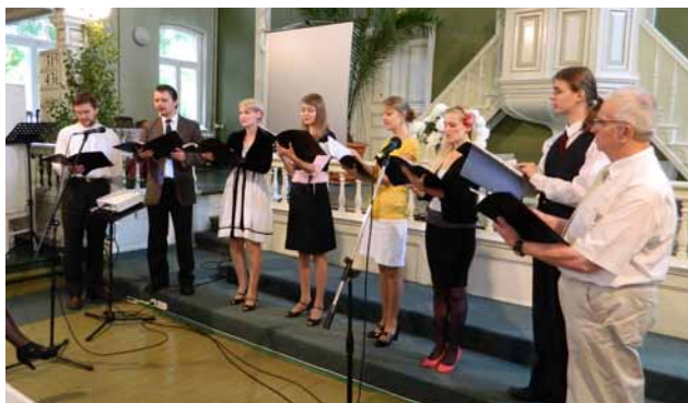
Ciānas draudzes vokālā grupa