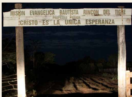
Zeme, ko sauc par Rincon del Tigre

Uz robežas mūs sagaidīja ar mašīnu, taču tā nebija īstā. Nācās gaidīt citu mašīnu – pickup truck , kuras kravas kastē laimīgs visu ceļu nosēdēja Papatoss. Mūsu šoferis nesās ar 160 km/h, lai arī atļautais ātrums bija 80 vai 90 km/h. Pa to laiku Papatoss saldi gulēja kravas kastē līdzās mantām, saņēma algu un tajās dienās nepateica nevienu vārdu arī tad, kad mūs kontroles punktā apturēja armija.