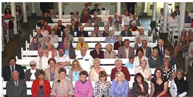
Ciānas draudzes dievkalpojums

Mūsu draudze būtu pateicīga par jūsu aizlūgšanām, jo gribam rīkoties saskaņā ar Dieva gribu, nevis savā gudrībā. Ir arī kāda lieta,