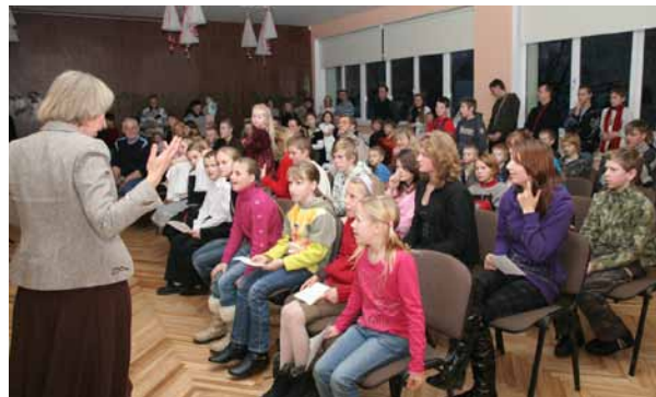
Ziemassvētku pasākums Rembatē

Tagad – sešdesmit gadu vecumā – es mācos Bībeles skolā, kurā cenšos iegūt nepieciešamās prasmes un zināšanas, lai es varētu kalpot cilvēkiem, kuri dzīvo dažāda veida atkarībās, sludinot par brīvību, ko sniedz Jēzus Kristus!