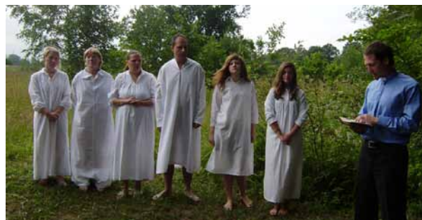
Kristības trīs māsām no Rembates draudzes

Pēdējā gada laikā Dievs mani ir pilnībā darījis brīvu ne tikai no narkotikām, bet arī no alkohola, nikotīna, riebiņa rakstura un daudziem psiholoģiskiem kompleksiem.