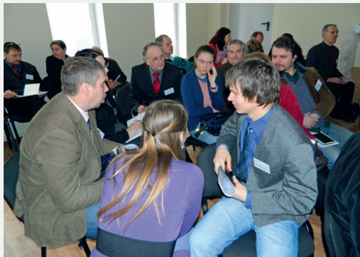
LBDS reģionālās konferences Liepājā dalībnieki mazajās grupās

Pēc pusdienām sekoja LBDS nozaru un apvienību prezentācijas.