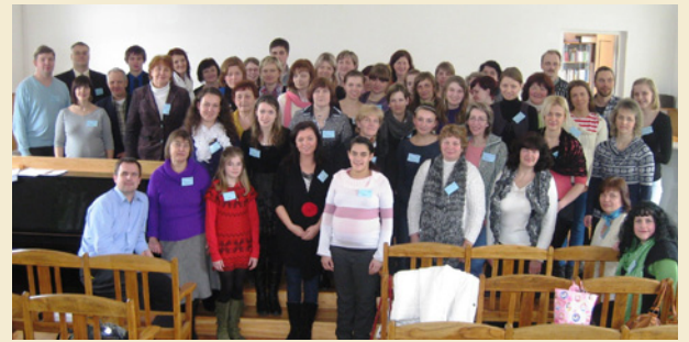
Svētdienskolotāju konferences dalībnieki Priekulē.

10. martā Priekules baptistu baznīcā notika svētdien-skolotāju seminārs “Ejot uz mērķi bērnu kalpošanā”. Nozīmīgs pārsteigums bija lielā atsaucība no skolotājiem – apmēram 60 skolotāju bija no