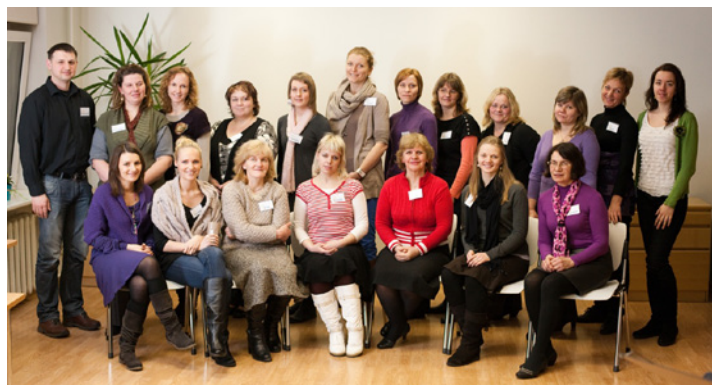
Timoteja skolas pirmā mācību gada dalībnieki.