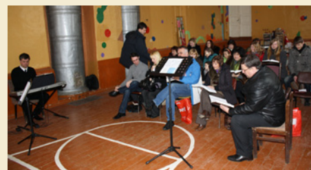
Draudzes dievkalpojums pagaidu telpās