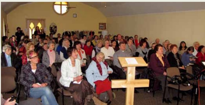
Konferences dalībnieki Madonas baptistu dievnamā.

aicināja māsas būt drošām un mīlestībā pildīt tik nozīmīgo Jēzus pavēli – stāstīt citiem brīnišķīgo glābšanas vēsti.