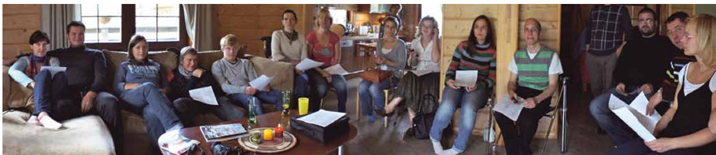
Garkalnes draudzes dievkalpojums.

Pirms diviem gadiem Dievs aicināja mūsu ģimeni sākt jaunu draudzi vietā, kur dzīvojam. Mēs ar sievu dzīvojam Ādažos jau piecus gadus. Kad sākām tur dzīvot, pamanījām, ka mūsu apkārtnē nav gandrīz nevienas draudzes. Mēs pat bijām pārliecināti, ka mūsu rajonā nav nevienas kristieša, izņemot mūs. Laikam ejot, mēs sajūtām pamudinājumu, ka Dievs vēlas redzēt kristīgu sadraudzību vietā, kur dzīvojam.