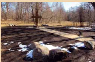
Piemīņas zīme Lielirbē.

Šī gada otrajās Lieldienās Ventspils novada Lielirbē tika atklāta piemīņas zīme vietā,