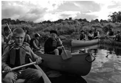
Laivu braucienu dalībnieki

Šā gada 21. un 22. jūlijā Priekules baptistu draudzes vīri organizēja laivu ekspedīciju Tēvi un dēli . Kad runa ir par tēvu un dēlu attiecībām un kopā pavadīto laiku, tad statistika liecina par ļoti dramatisku situāciju. Tāda kvalitatīva kopā pavadīšana tēvam ar dēlu ir ļoti maz. Jaunam zēnam pietiek viena diena kopā ar savu tēti un viņš