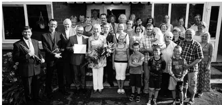
Ainažu draudzes locekļi ar viesiem.

Vēlam sludinātājam un viņa ģimenei Dieva vadību un gudrību kalpošanas darbā!