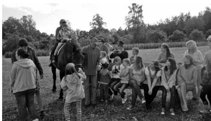
Jāšanas nodarbības laikā