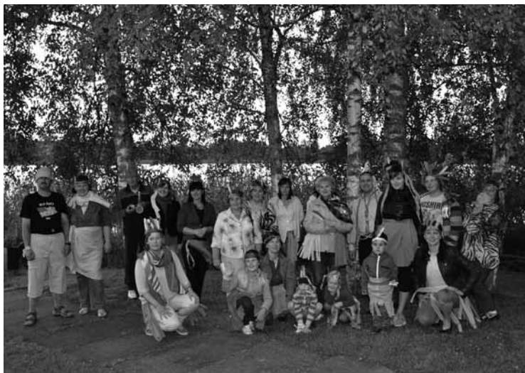
Svētdienskolas nometnes dalībnieki

No 12.-14. jūlijam svētdienskolotāji pulcējās Svētdienskolu apvienības rīkotajā mācību nometnē gleznainā Sasmakas ezera krastā viesu namā "Vītoli". Nometnes nosaukums "KĀ BULTA" atspoguļoja LBDS Kongresā pieņemtā Nākotnes redzējuma trīs galvenās vērtības un darbības virzienus, akcentējot jautājumus, kas attiecas uz bērniem un svētdienskolotājiem.