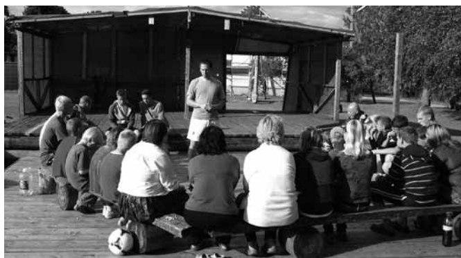
BPI Drafts nodarbību laikā

Augustu sākumā notika BPI DRAFTS 3. līmeņa nometne. Šāda veida nometne tiek rīkota otro gadu. Tajā piedalās tie, kuri piedalījušies pirmajos divos līmeņos un visu gadu ir strādājuši, lai izveidotu komandu savā draudzē, lai kopīgi piedalītos nomet-