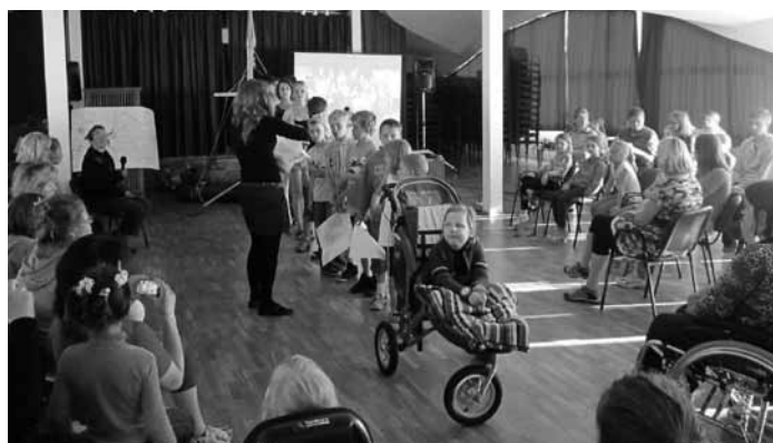
Nometnes bērni nodarbībā

māmiņām un katram nometnes darbiniekam, ļaujot izjust kaut nedaudz no Dieva mīlestības pret mums, ļaujot saskatīt cerības stariņu ikdienas pelēcībā un norādīt uz visa laba devēju – Dievu. Paldies ikvienam, kurš nežēloja laiku un pūles, lai nometne izdotos!