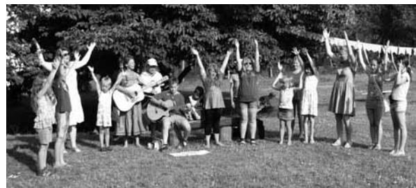
Nometnes dalībnieki slavē Dievu

Karostas jaundibināmās draudzes misijas stacijā Vērgalē no 2.-6. jūlijam notika piedzīvojumu skola "VISU vai NEKO". Ik dienas tajā piedalījās 20-25 bērni un jaunieši no Vērgales ciema un pagasta.