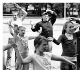
Bērni nodarbību laikā