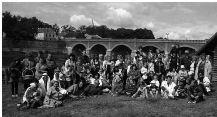
Nometnes dalībnieki Kuldīgā

Protams, nometnes dienas bija piepildītas vēl ar daudz ko citu – mierīgām sarunām, meža zemeņu lasīšanu, orientēšanos, meklējot laivas piederumus pils parkā, dziesmām pie ugunskura ... Visu jau nevar uzskaitīt! Skaidrs ir viens: tās bija bagātas un skaistas dienas, kas atnesa prieku bērniem, viņu