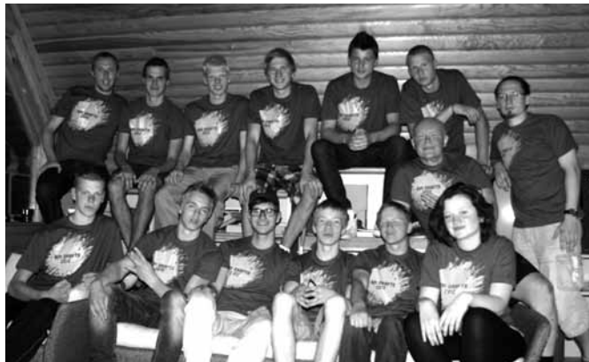
BPI Drafts dalībnieki

Varam būt pateicīgi Dievam, ka jau ceturto gadu tiek organizēts BPI DRAFTS, kura mērķis ir aizsniegt, uzrunāt, iedvesmot un sagatavot kalpošanai jaunus puišus vecumā no 14 līdz 20 gadiem. Kā jau ierasts, arī šogad visas nometnes notika lauku sētā "Ganības". Šovasar nometnēs piedalījās jaunieši no dažādām Latvijas draudzēm: Rīgas, Liepājas, Talsiem, Ventspils, Viesītes, Jelgavas, Valmieras un Ogres.