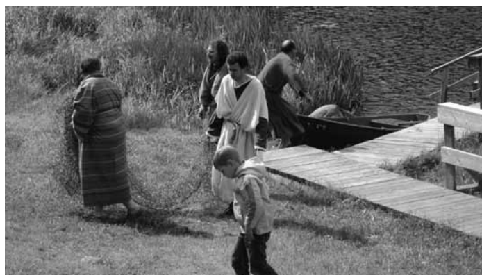
Pie bērniem dodas četri Jēzus mācekļi