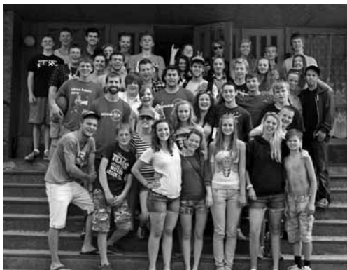
Nometnes dalībnieki kopā ar ASV jauniešiem

No 30. jūnija līdz 6. jūlijam Cīravas arodividusskolā norisinājās angļu valodas nometne, kuru organizēja Aizputes baptistu draudzes jaunieši sadarbībā ar biedrību "Jauniešu Virzība", kuru pārstāvēja 14 jaunieši no ASV. Uz nometni tika aicināti Aizputes