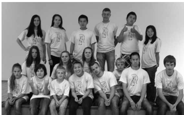
Nometnes "Ageless" dalībnieki kopā ar Kanādas jauniešiem

No 25.-28. jūnijam Mežgalciema draudze rīkoja angļu valodas nodarbības bērniem un pieaugušajiem, kurs vadīja misionāri no "Greater Europe Mission". Tās apmeklēja ap 20 cilvēku no Otaņķiem un Nīcas.