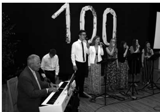
Dzied jauniešu ansamblis no Rīgas Mateja draudzes