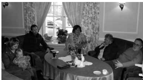
Bībeles studija Nīcā

Kad mēs pirms 4 gadiem ar ģimeni meklējām vietu dzīvošanai ārpus Liepājas, mēs par jaunu draudžu veidošanu nedomājām. Tas bija nepārprotams Dieva ceļš, kas mūs atveda uz Rudes ciemu Liepājas ezera dienvidu galā, Otaņķu pagastā.