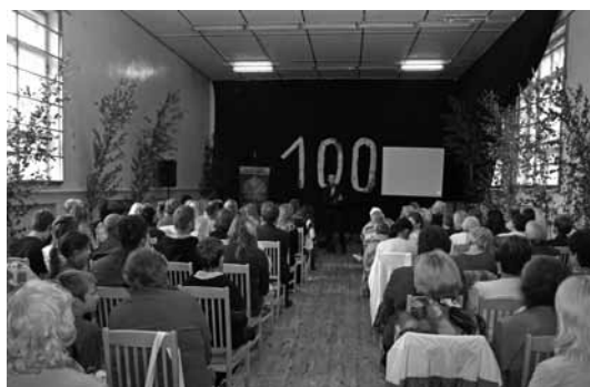
Uzrunu saka LBDS bīskaps Pēteris Sproģis

Draudze darbojas dažādās nozarēs – darba dienu vakaros notiek mazo grupu sanāksmes (gan jauniešiem, gan pieaugušajiem), īpašas sievietes