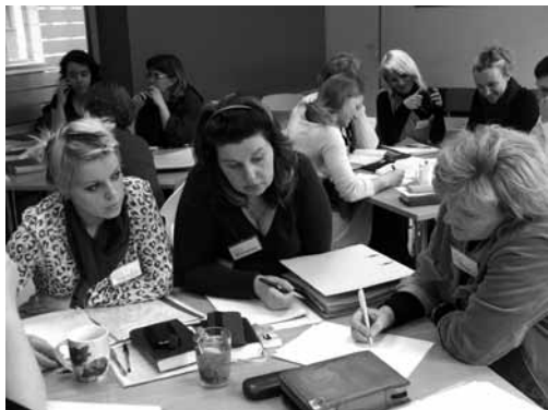
Timoteja skolas dalībnieces nodarbības laikā

Šī gada februārī mācības uzsāka BPI Timoteja skolas pirmais kurss. Bijušas nodarbības, mājas darbi, sevis izvērtēšana, pārdomas, atskaites. Dalībnieki iepazīnušies viens ar otru. Daudzi kļuvuši par