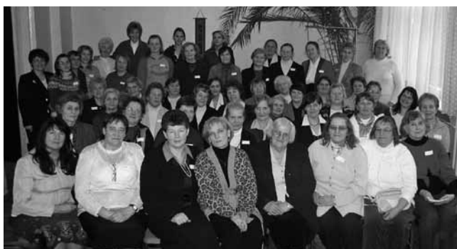
Māsu vadītāju sanāksme Rīgā 2007. gadā