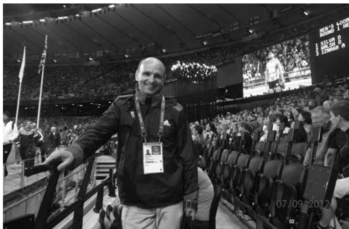
Olimpiskajā stadionā pirmajā rindā, pavisam netālu no Paraolimpiskās lāpas

Piedalīšanās Londonas 2012 Paraolimpiskajās spēlēs kā kapelānam ir bijusi aizraujoša, ļoti daudzveidīga un noderīga pieredze. Iegūtās pieredzes lietošana un vēlēšanās līdzdalīt prieku par Dieva dotajām iespējām ir iemesls, kāpēc cenšos stāstīt par piedzīvoto Londonā. Mans ceļš uz Paraolimpisko spēļu brīvprātīgā darbu aizsākās 2006. gada Pasaules hokeja čempionātā, kas notika Latvijā. Toreiz biju Kazahstānas komandas pavadonis. Iekļūšana Paraolimpisko spēļu kapelānu komandā ir ļoti liels brīnums. Pirmkārt, no aptuveni sešdesmit kapelāniem, kuri strādāja Paraolimpiskajās spēlēs, lielākā daļa bija cilvēki, kuri ir kādas kristīgas sporta organizācijas deleģēti uz