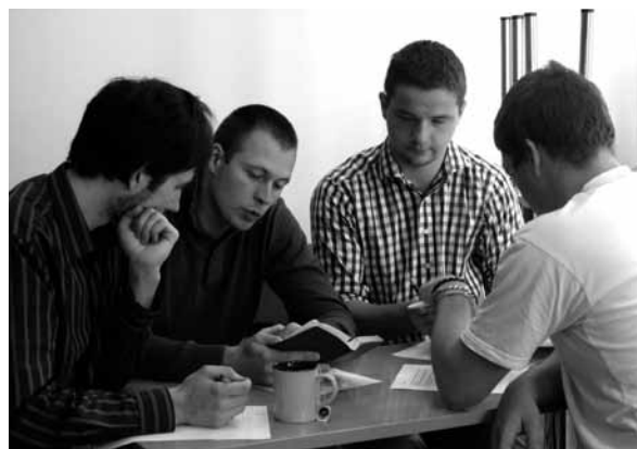
Atvērto durvju dienu dalībnieku pārrunas