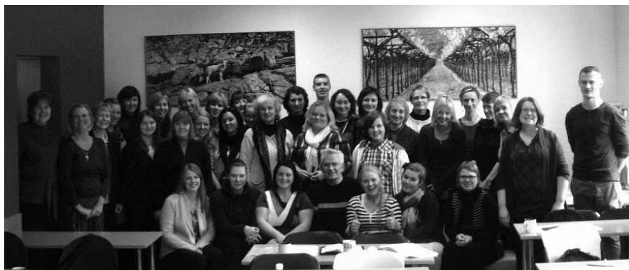
Svētdienskolas semināra dalībnieki