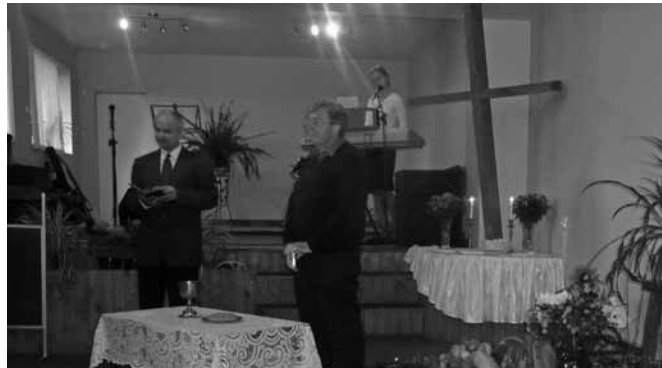
Tukuma draudzes svētku dievkalpojums