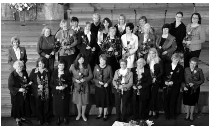
Bijušās un esošās padomes māsas un māsu vadītājas draudzēs