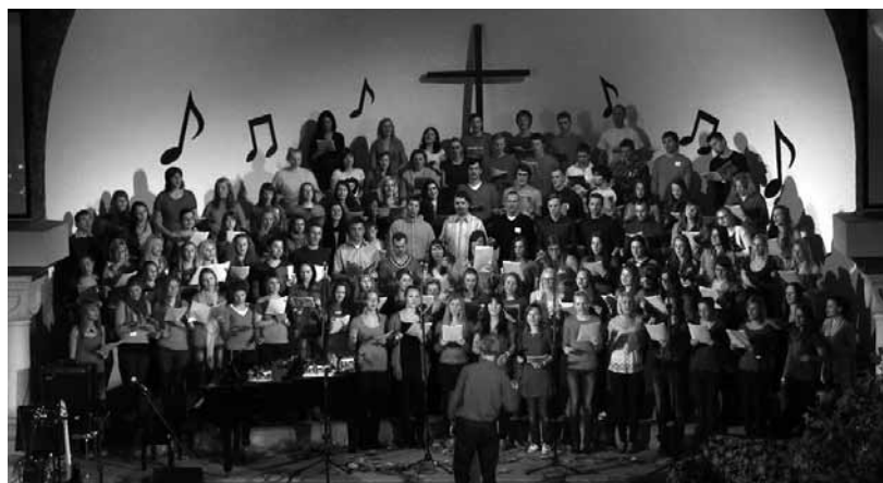
"Kora darbnīcas" koris