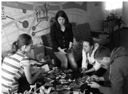
Saruna ar Refleksijas kartiņām

Droši zinām, ka viens puisis uzticēja savu dzīvi Kristum! Tas bija liels prieks komandai, jo gandrīz puse no mums nedēļas gaitā bija ar viņu runājusi. Dievs mūsu sirdīs ir licis vēl vairākus studentus, kuriem vajadzīgs laiks, lai pieņemtu Kristu un radikāli mainītu savu dzīvi. Tāpēc, lūdzu, lūdziet par šiem jauniešiem, lai viņi ir kā raža, kas gatava plaujai.