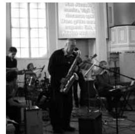
Liepājas Pāvila draudzes slavēšanas grupa dievkalpojumā

Liepāja, Pāvila draudze. 10. novembrī Pāvila draudzē notika “Draugu dievkalpojums”. Pirmais šāda veida dievkalpojums notika pirms gada. Katram draudzes loceklim bija iespēja ļaut Dievam sevi lietot.