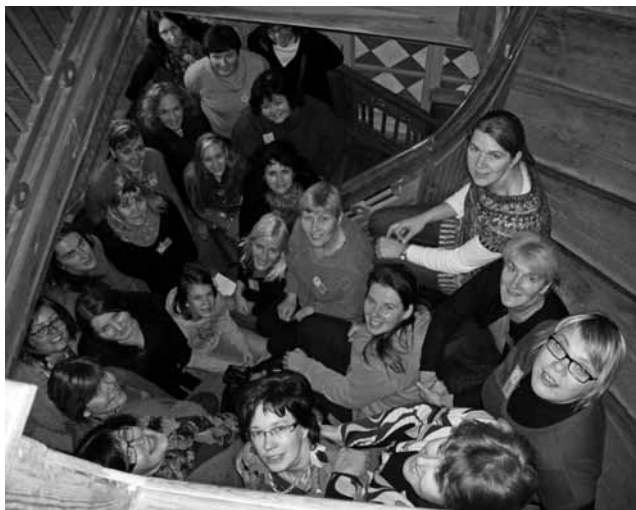
Lielākā daļa no nometnes dalībniekiem