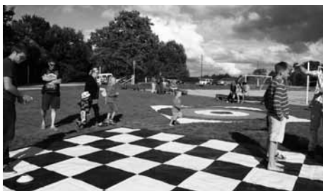
Svētku viesi izmēģina milzu galda spēles

15. augustā Talsu novada Pļavu ciemā Nāriņciema draudze sadarībā ar Talsu draudzi rīkoja pasākumu "Teksasieši Pļavās", kurā ar prieku izmantojām "Svētki tavā pilsētā" aprīkojumu. Misijas nedēļas ietvaros Talsu draudzē ciemojās draugi no Teksasas štata, ASV, un tad dzima ideja kalpot arī ārpus Talsiem.