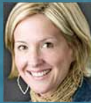
Dr. BRENĒ BRAUNA Hjūstonas Universitātes Sociālā darba aspirantūras pētniece, profesore