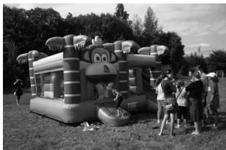
Bērnu atrakcijas Šķaunē