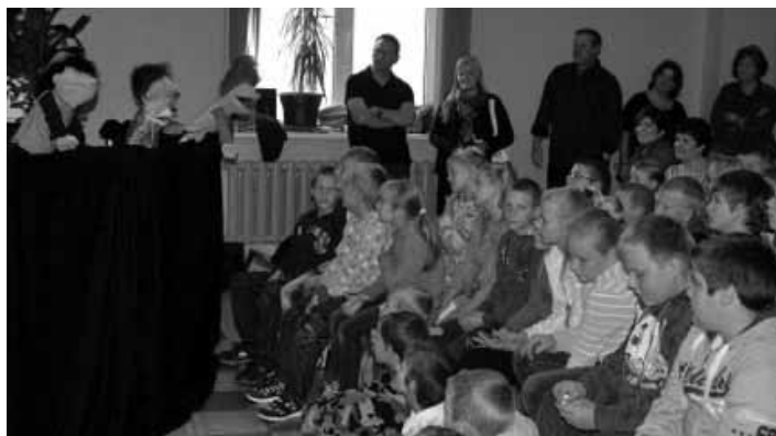
Priekules draudzes locekļi kopā ar viesiem apciemoja vairākas Priekules novada skolas