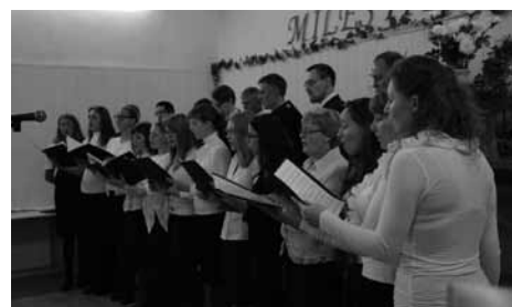
Svētku dievkalpojumā dzied draudzes koris

mūzikas koncerts, kurā piedalījās viesi no Rīgas, Jēkabpils, Jelgavas un Lietuvas draudzēm. Svētdien, 6. oktobrī, dievkalpojumā pateicāmies Dievam par