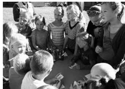
Svētku dalībnieki radošajā darbnīcā Skrīveros

Pateicoties LBDS projektam “Svētki tavā pilsētā”, 7. septembrī Skrīveru baptistu draudzes nama pagalmā notika pasākums bērniem “Mans prieka avots”. Dievs mūs svētīja ar ļoti skaistu, saulainu dienu. Bērni kopā ar vecākiem jau pusstundu pirms pasākuma sākuma pulcējās pagalmā. Skanēja brīnišķīga kristīga mūzika, tika uzstādītas piepūšamās “mājiņas”. Mūsu