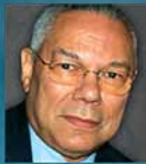
KOLINS PAUELS Ģenerālis