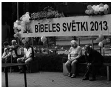
“Ģimenes diena” Ogrē

Ar LBDS projekta “Svētki tavā pilsētā” atbalstu 31. augustā Ogrē organizējām īpašu “Ģimenes dienu”. Visas dienas garumā