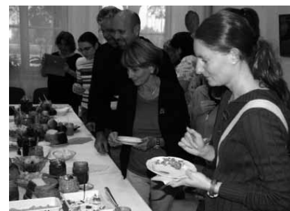
Viesi degustē Priekules senioru biedrības “Zilais lakatiņš” sarūpētos gardumus

Viesi tika iepazīstināti arī ar citām aktivitātēm Priekulē. Viņi piedalījās kulināro gardumu izstādē un degustācijā, ko bija sarūpējušas Priekules senioru biedrības “Zilais lakatiņš” dalībnieces, un apmeklēja radošo darbu izstādi. Bija noorganizēta arī ekskursija uz Liepāju. Devāmies pie jūras, kur bija sākusies vētra, tāpēc viesiem atrašanās pie Baltijas jūras likās kā