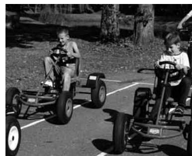
Velokartu sacensības Tārgalē

Piepūšamās atrakcijas, velokartus, popkornu un citus priekus baudīja kopā apmēram 150 bērnu. Vairāki skolotāji no Ventspils svētdienskolas runājās, draudzējās, stāstīja par Dievu un vienkārši pavadīja laiku ar Tārgales bērniem. Bija liels prieks redzēt bērnu sajūsmu, patieso prieku un dzirdēt smieklus. Vairāki jautāja: “Kāpēc jūs šo visu darāt?” Katrs bērns saņēma ielūgumu uz nākamo pasākumu, jo mēs turpinām kalpot Tārgalē.