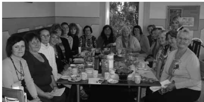
Draudzības dienu brokastis sievietēm

Viesi dalījās ar savu pieredzi un ieteikumiem pasākumos dažādām vecuma grupām un draudzes nozarēm. Vakars pusaudžiem un jauniešiem bija piepildīts ar dziesmām, spēlēm, sadraudzību. Brokastīs atsevišķi vīriem un sievietēm viesi dalījās savos laimīgos ģimenes noslēpumos un stāstīja par izmaiņām ģimenes dzīvē, kad ģimenes vadība ir uzticēta Dievam. Māmiņu tikšanās reizē daži viesi stāstīja par savas draudzes kalpošanas nozarēm, kamēr citi nodarbojās ar atnākušajiem bērniem. Sestdienas vakarā Priekulē notika koncerts, kurā klātesošos uzrunāja viesu liecības par Dieva darbiem viņu dzīvēs un līdz sirds dziļumiem izjustās dziesmas, liekot pievienoties divvalodīgā patiesā Dieva pielūgsmē un slavēšanā.