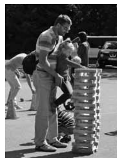
"Ģimenes diena" Baložos

Baloži. 24. augustā Ķekavas novada Baložu pilsētā kristiešu mājas grupa jau otro gadu organizēja pasākumu "Ģimenes diena". Pasākuma mērķauditorija bija apkārtnē dzīvojošās ģimenes. Kopā