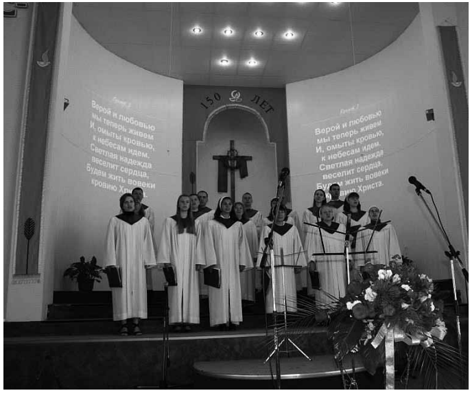
Dzied koris svētku dievkalpojuma laikā

gadsimtā doties dziļāk Krievijas impērijā, lai tiktu pie savas zemes un sāktu dzīvi no jauna. Starp daudzajiem latviešiem, kuri