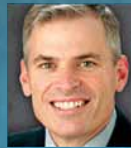
PATRIKS LENCIONI The Table Group dibinātājs un prezidents, bestselleru autors