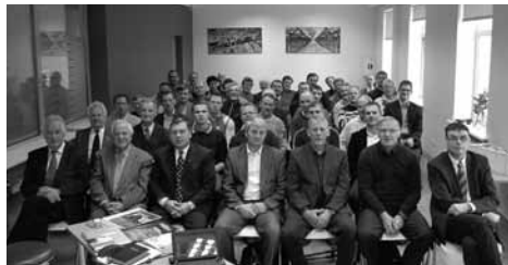
Garīdznieku konferences dalībnieki

12. oktobrī Savienības namā notika LBDS Garīdznieku brālības konference, kurā mācītājiem un sludinātājiem bija iespēja garīgi stiprināt vienu otru, mācīties, kā arī ieklausīties celsmīgās viesu mācītāju uzrunās.