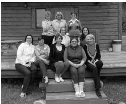
Sieviešu apvienības reģionālā seminārā dalībnieces