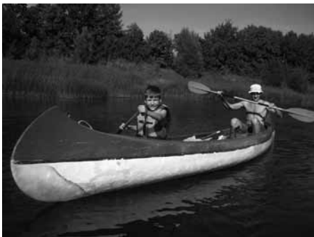
Tēvs un dēls vienā laivā - prieks būt kopā!

Karosta, Liepāja. Tēvu dienā, septembra otrajā svētdienā, mēs organizējām laivu braucienu tēviem ar bērniem. Tā bija mūsu svētdienas dievkalpošana. Kaut arī bijām plānojuši vairāk dalībnieku, beigās piedalījās trīs tēvi ar 5 bērniem.