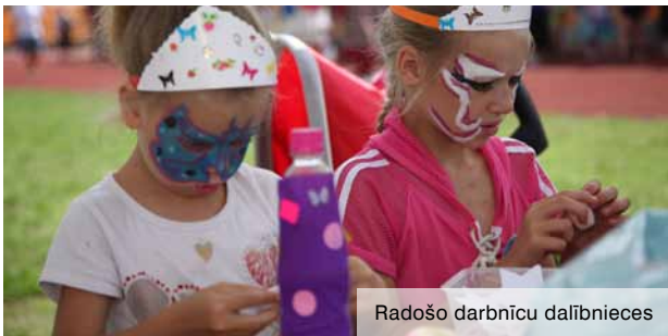
Radošo darbnīcu dalībnieces