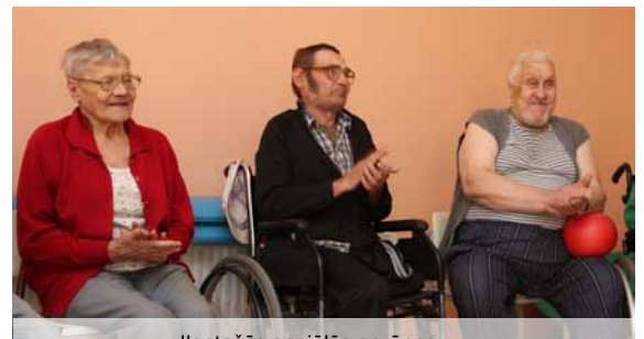
Ilgstošās sociālās aprūpes un rehabilitācijas nodaļas iemītnieki