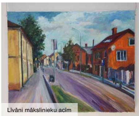
Līvāni mākslinieku acīm