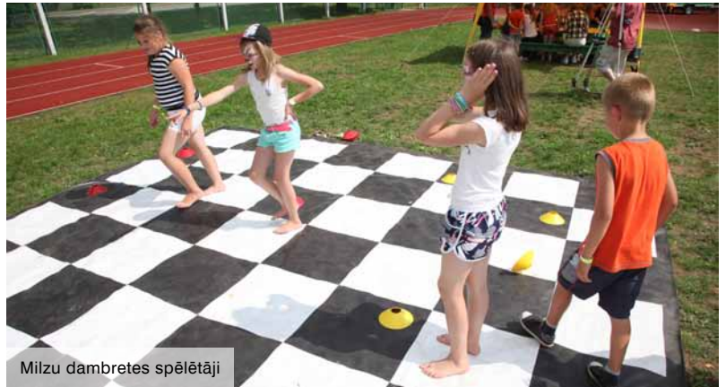
Milzu dambretes spēlētāji