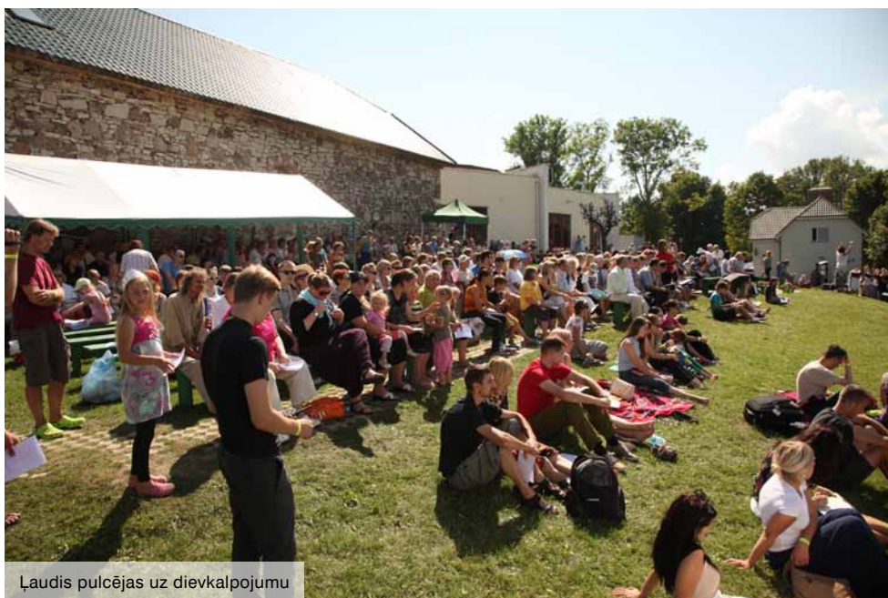
Ļaudis pulcējās uz dievkalpojumu