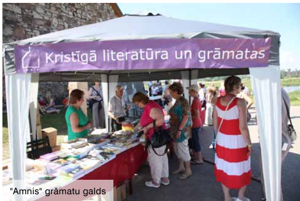
"Amnis" grāmatu galds