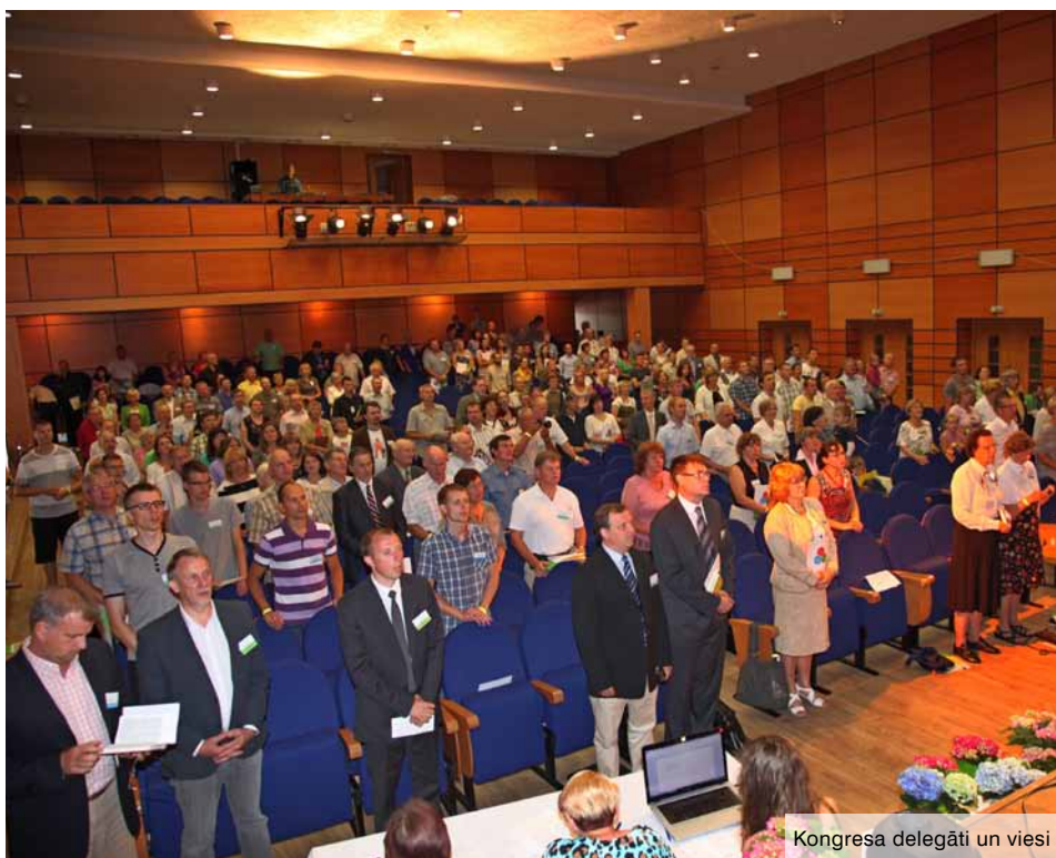
Kongresa delegāti un viesi