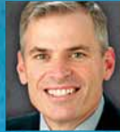
PATRIKS LENCIONI The Table Group dibinātājs un prezidents, bestselleru autors