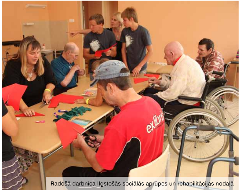
Radošā darbnīca Ilgstošās sociālās aprūpes un rehabilitācijas nodaļā