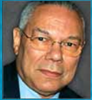
KOLINS PAUELS Ģenerālis