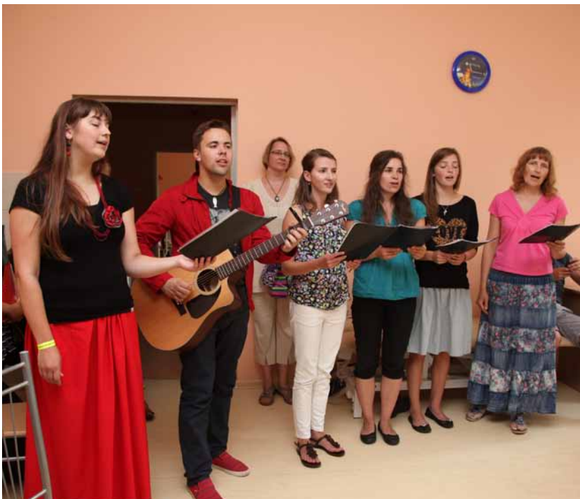
Talsu draudzes jauniešu priekšnesums Ilgstošās sociālās aprūpes un rehabilitācijas nodaļā