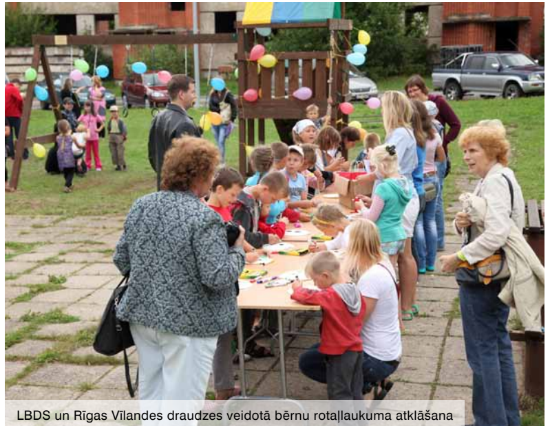
LBDS un Rīgas Vīlandes draudzes veidotā bērnu rotaļlaukuma atklāšana