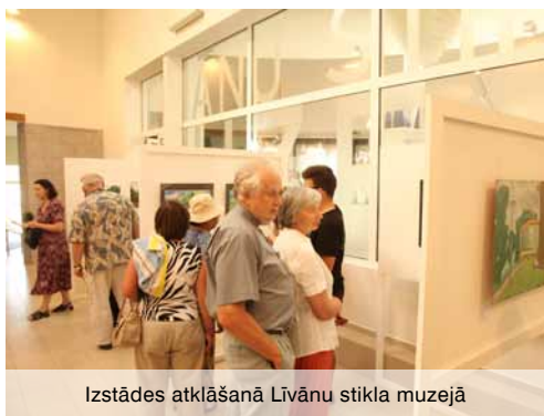
Izstādes atklāšanā Līvānu stikla muzejā