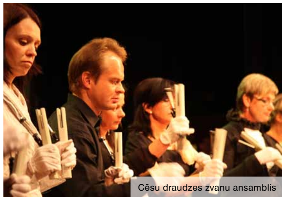
Cēsu draudzes zvanu ansamblis