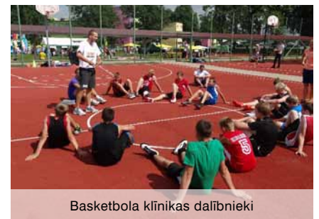
Basketbola klīnikas dalībnieki