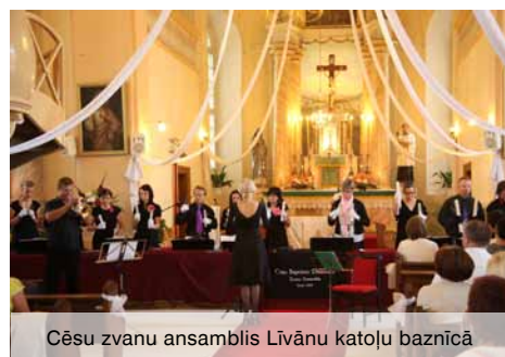
Cēsu zvanu ansamblis Līvānu katoļu baznīcā