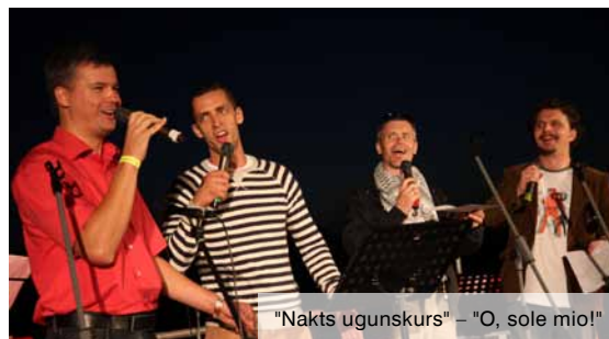
"Nakts uguns" – "O, sole mio!"