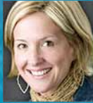
Dr. BRENĒ BRAUNA Hjūstonas Universitātes Sociālā darba aspirantūras pētniece, profesore