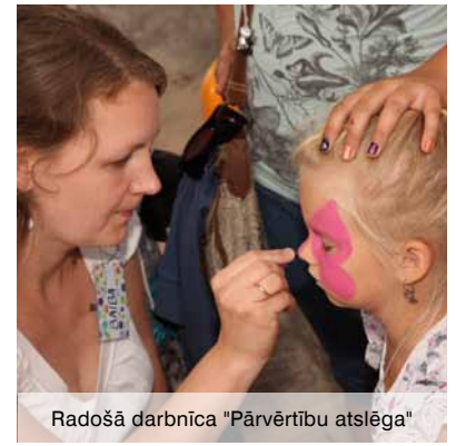
Radošā darbnīca "Pārvērtību atslēga"