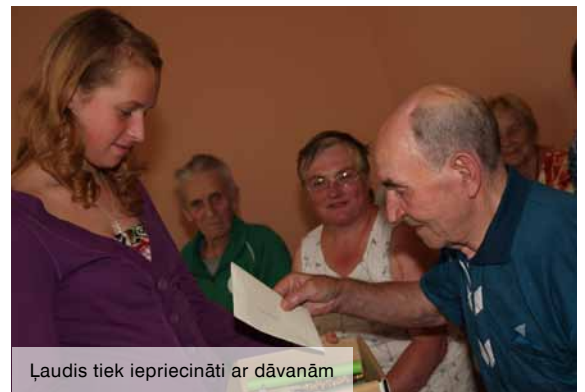
Ļaudis tiek iepriecināti ar dāvanām