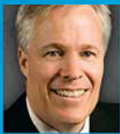
DŽOZEFS GRENIJS VitalSmarts līdzdibinātājs, biznesa bestselleru autors