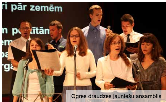
Ogres draudzes jauniešu ansamblis