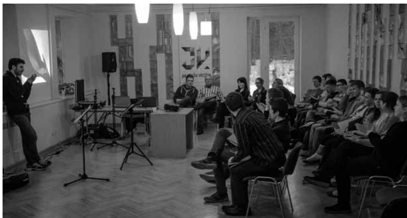
Jauniešu vadītāju skolas nodarbība