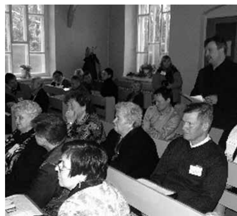
Draudžu pārstāvju diskusija