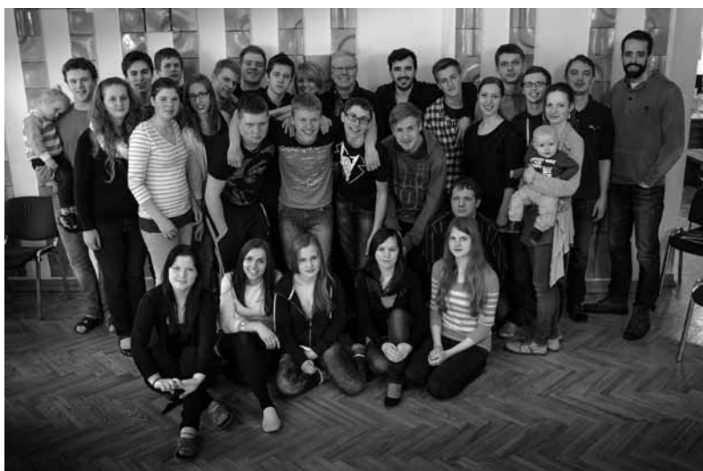
Jauniešu vadītāju skolas dalībnieki un vadītāji