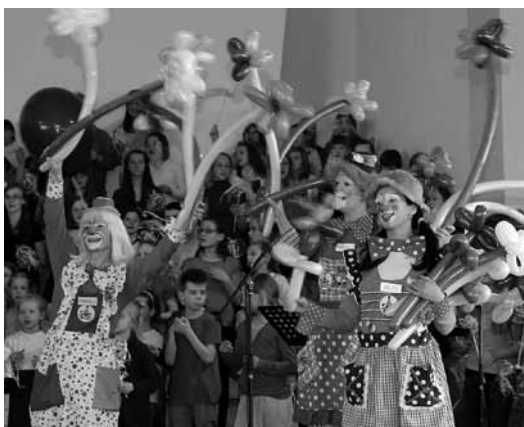
Dziesmu dienā bērnus izklaidēja arī klauni