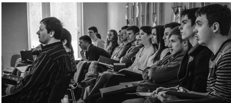
Jaunieši nodarbības laikā