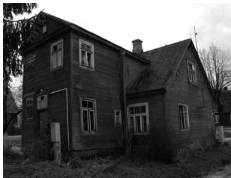
Agrākais Līvānu baptistu draudzes lūgšanu nams