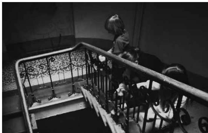
Rīgas Centra topošā draudze mazgā kāpņu telpu kopā ar kaimiņiem

Tāda ir dzīve mazā kopienā. Katrs cilvēks ir svarīgs. Katrs stāsts ir unikāls un pārsteidzošs. Tā īsti neko nevar noslēpt. Ja kādam iet grūti, tad pārējie arī pārdzīvo, atbalsta. Tam visam pāri var redzēt, ka Dievs darbojas. Neviens nav perfekts, bet tieši tādu cilvēkus Dievs spēj izmantot, lai celtu Savu draudzi un aizsniegtu arvien jaunus cilvēkus Savai Valstībai.