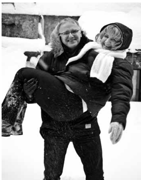
30 gadu kāzu jubileja

Liels izaicinājums man personīgi bija, kad vecākai meitai sirdī bija misija Āfrikā.