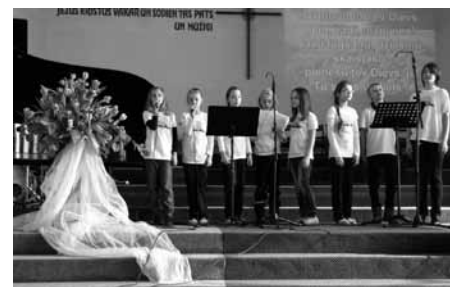
Ventspils draudzes ansamblis "Gaismiņas"