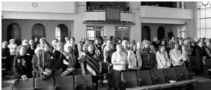
SKA kongresa dalībnieces