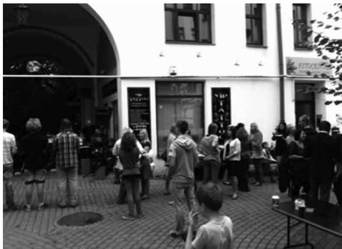
Upīša pasāžas svētki, ko organizēja Rīgas Centra jaundibināmā draudze

Jebkuras draudzes dzīve ir interesanta, bet visinteresantākā tomēr ir jaunas draudzes dzīve. Ja tu ļauj Dievam darboties, tad tā īsti neko nevar paredzēt. Kas būs tie cilvēki, kas atsauksies tavam aicinājumam? Kā mēs vadīsim dievkalpojumu? Kurš būs