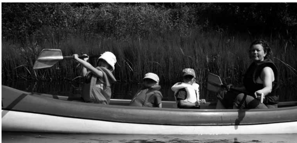
Ar laivu pa Salacu