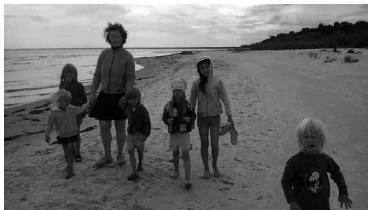
Ragciemā pie jūras

Tā kā tie nav mani bioloģiskie bērni, tas man nozīmē pielāgošanos, pierašanu. Savā ziņā tas ir darbs – iemīlēt bērnus. Kādu iemīlēt ir viegli, tas nāk pats no sevis, un citu tev jānācās iemīlēt. Visiem bērniem ar vienām emocijām nepietiks, man viņus jānācās iemīlēt, ka viņi ir mani