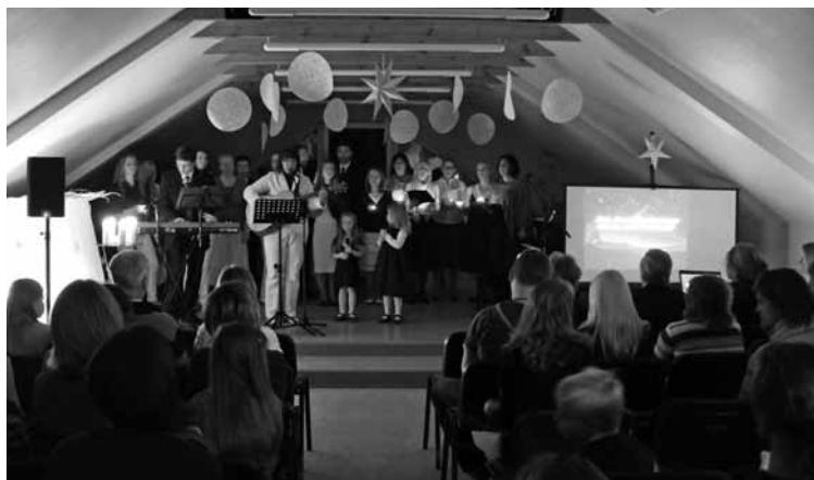
Baltijas Pastorālā institūta Muzikālo vadītāju skolas koncerts

Muzikālo vadītāju skola ir skola, kas sagatavo kora diriģentus un ansambļa vadītājus, pielūgsmes vadītājus, mūziķus un dziedātājus, lai tie veiksmīgāk varētu kalpot draudzēs. Skolas studenti pirmajā mācību pusgadā kopīgi ir aicināti izstrādāt projektu – koncertu, kurš tiek realizēts kādā Latvijas draudzē pirmajā Adventa svētdienā.