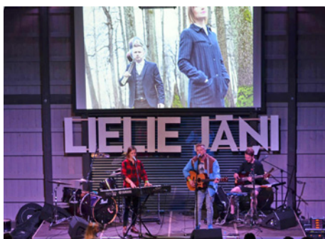
Festivāla īpašie viesi – grupa "My Radiant You"

Trīs dienās programma bija bagāta – kamēr pieaugušie meistarklasēs mācījās dažādus kafijas pagatavošanas "knifiņus", uzzināja veselīga uztura noslēpumus, iedvesmojās, lai dotos piedzīvojumos, kā arī mēģināja izprast atšķirību starp "normālu" un lielisku dizainu, bērni līdz sirds patikai izrakojās