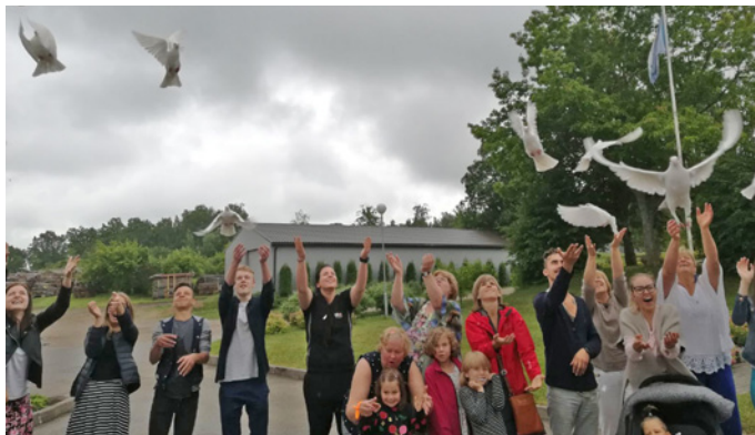
Noslēgumā dalībnieki laiž gaisā pasta baložus un gaisa balonus ar saviem sapņiem

Ļoti īpašs viesis nometnē bija puisis ratiņkrēslā, kurš ikdienā nodarbojas ar gleznoša-