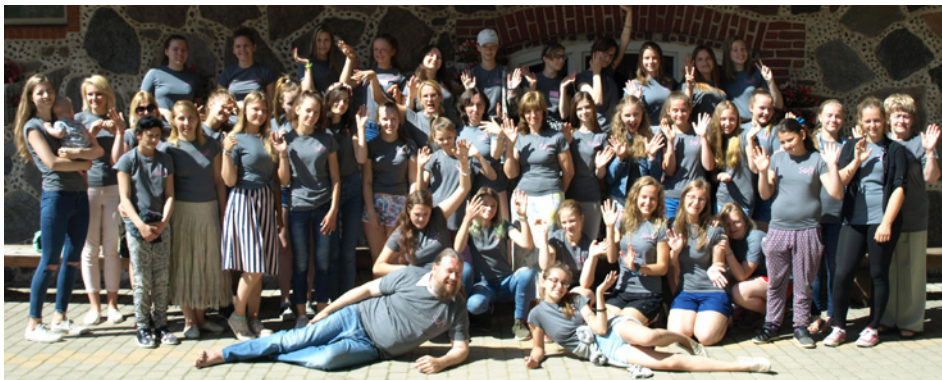
"SOFT" dalībnieces un viesi

Meitenes izpaudās radošajās darbnīcās – mālu, nagu dizaina, mezglošanas, tamborēšanas un našķu gatavošanā, bet brīvajā laikā izstaigāja baskāju un ziedu taku. Protams, neizpalika arī vakars pie ugunskura ar slavas dziesmu dziedāšanu Tam Kungam un mielošanos ar pašu gatavotiem našķiem.