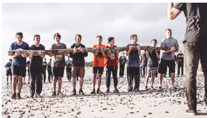
1. līmeņa BPI DRAFTS puīši darbībā

Augusta sākumā organizējam 2. un 3. līmeņa nometni. Uz 3. līmeņa nometni atbrauca 6 puīši, kas tika sagatavoti tam, lai būtu kapteiņi – komandu vadītāji. Par šiem puīšiem šaubu vairs nav – viņi ir ar iniciatīvu, atbildības sajūtu un vēlmi vadīt. Divas dienas mācījāmies, kā vadīt sevi, sagatavot svētrunu, vadīt komandu un vadīt kalpošanu (projektu). Tad komandu vadītājiem pievienojās BPI DRAFTS 2. līmeņa 22 dalībnieki, kuri tika sadalīti komandās. Divu dienu garumā notika komandu saliedēšana, tad visi devāmies misijā. Šogad misija notika Limbažos, sadarbībā ar Limbažu baptistu draudzi un sludinātāju Mārtiņu Anševicu, kurš pats reiz piedalījās BPI DRAFTS nometnēs.