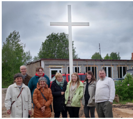
Baltais krusts pie jaunās draudzes ēkas