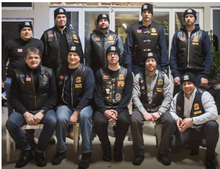
Kristīgās motociklistu asociācijas Latvijas nodaļa 2017. gadā