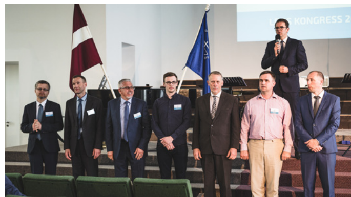
Daļa no LBDS jaunievēlētās Padomes