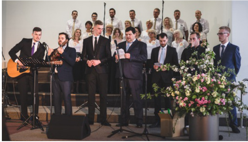
Absolventu muzikālais sveiciens