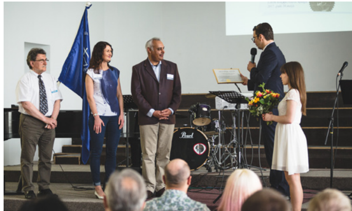
LBDS jaunākā draudze - Internacionālā draudze "Grace"