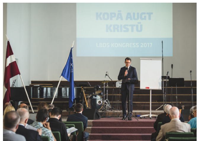
Bīskaps Pēteris Sproģis uzrunā Kongresa dalībniekus