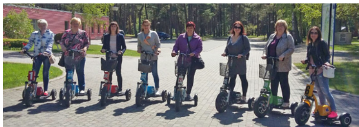
Māmiņas uz TRIK velosipēdiem

Vajadzības ir visiem vecākiem, taču vecākiem, kuri audzina smagi slimus bērnus, vajadzības ir grūtāk apmierināt. Darbs 24 stundas diennaktī 7 dienas nedēļā, kā to dažkārt nākas darīt šo bērnu māmiņām un tētiem, rada lielu fiziskas un emocionālas sabrukšanas risku. Viens no veidiem, kā mēs varam palīdzēt, ir dot viņiem atelpas brīdi dažas stundas nedēļā, mēnesī vai ceturksnī. Tā mēs varam parādīt Jēzus mīlestību šīm ģimenēm.