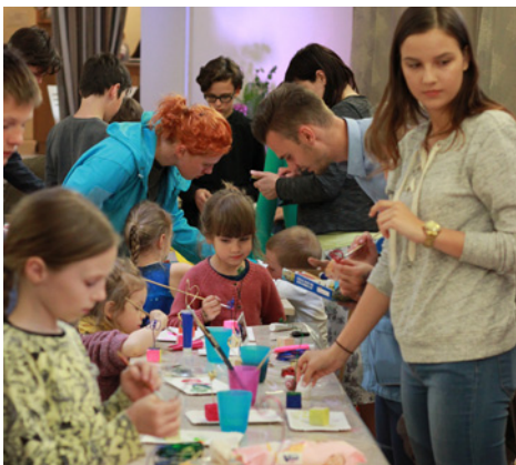
Radošās aktivitātes bērniem