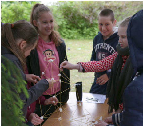
Radošās aktivitātes jaunajiem