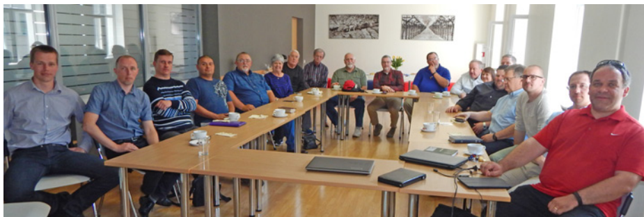
Tikšanās ar LBDS draudžu pārstāvjiem

Oklahomieši piedalījās LBDS Kongresā un Baltijas Pastorālā institūta izlaidumā. Pusdienu pārtraukumā viesi iepazinās ar to draudžu vadītājiem, kuras apciemoja nākamajā dienā. Oklahomas pārstāvji devās uz Grobiņas, Jelgavas, Madonas, Ogres Trīsvienības, Rīgas Mateja, Rīgas Semināra un Ventpils draudzi, kā arī uz Ropažu un Rojas jaundibināmo draudzi. Viesi uzklausa deviņu garīdznieku un draudžu dibinātāju stāstus par kalpošanas plāniem un sadarbības iespējām. Uzvāva oklahomieši apskatīja nometņu kalpošanas centru "Ganības" un uzklausa BPI Pastorālās kalpošanas programmas studentu kalpošanas plānus. Noslēgumā viesi tikās ar LBDS nozaru vadītājiem un stāstīja par pamanītajām sadarbības iespējām.