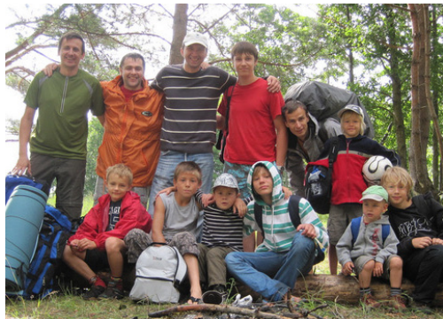
Pirmais pārgājiens 2011. gada jūlijā