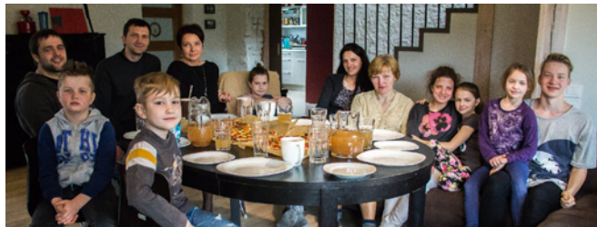
Mājas grupa Brankās

pantus, kuri mūs visvairāk uzrunājuši, caur tiem pastāstot savu pieredzi. Svarīgi, ka varam veidot arī katrs savas personīgās un kopīgās apņemšanās, lai nākamreiz stāstī-