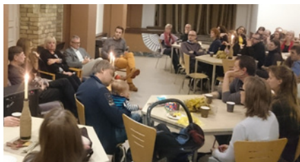
Vecāku vakars Rīgas Mateja draudzē

Rīgas Mateja draudzē jau ilgu gadu darbojas svētdienskola, kurā bērni tiek mācīti par Dieva mīlestību, tomēr Bībelē teikts, ka galvenā atbildība par bērnu audzināšanu ir uzticēta vecākiem. Daži Vecāku vakari Mateja draudzē ir notikuši arī iepriekš, bet šajā gadā tos mērķtiecīgi veidojam, lai atbalstītu vecākus un veicinātu vecāku sadraudzību. Uz šiem vakariem aicinām draudzes vecākus, bet tā ir lieliska iespēja uzaicināt arī tos, kuri nav draudzē un kurus interesē bērnu audzināšanas jautājumi.