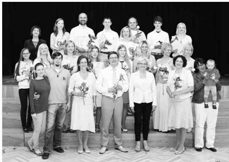
BPI MVS 2014. gada absolventi un pasniedzēji