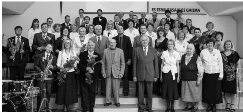
Jelgavas draudzes koris un bijušie koristi kora jubilejas dievkalpojumā