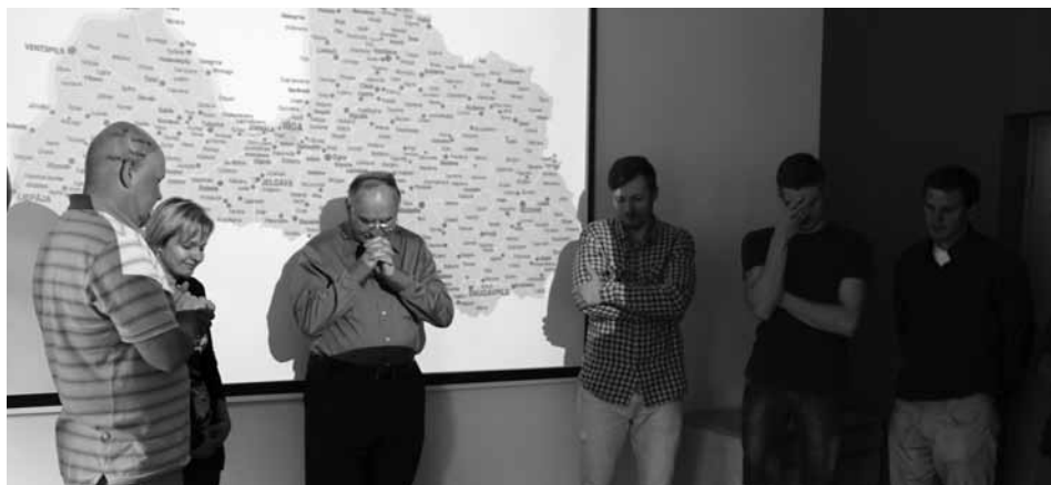
Aizlūdzot par Latviju ar BPI studentiem