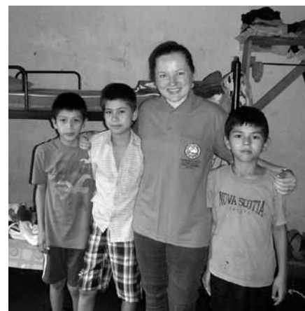
Atvadu bilde ar kādiem no zēnu internāta iemītniekiem