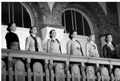
Vokālā grupa "Latvian Voices"

Rīgas Mateja draudze Baznīcu naktī iepazīstināja ar savām kalpošanas nozarēm. Muzikālās kalpošanas kolektīvi visa vakara garumā sniedza pusstundas koncertus, kurus papildināja mācītāju uzruna par pasākumam izvēlēto tēmu – Mielasts. Īstu mielastu varēja baudīt ikviens nejaušs garāmgājējs, mērķtiecīgs Baznīcu nakts apmeklētājs vai draudzes loceklis. Vislielāko pārsteigumu sniedza āra "terase" – kafējnīca ar galdiņiem un nojumi uz Matīsa ielas trotuāra! Pārsteidzoša bija draudzes māsu rosība ap bagātīgajiem pašizcepto kūciņu galdiem. Garāmgājēju izsauceieni: