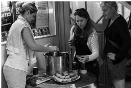
"Metro" tēja ar keksiņiem

Tuvojoties 6. jūnijam, baznīcā arvien biežāk risinājās kārtošanas, dekorēšanas un patīkamas vides radīšanas darbi, lai Vīlandes telpas ikvienam atnācējam ļautu sajust – Tu esi šeit gaidīts! Jau pirms