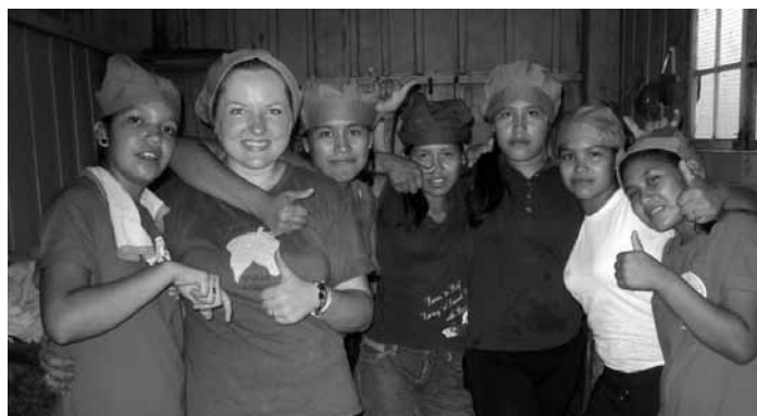
Kopā ar meitenēm tīrot virtuvi, atradām pavāra cienīgas micītes

Februārī tiku pie sava pirmā īstā amata Rinkonā – virtuves pārzine. Tas nozīmē gādāt, lai virtuvē vienmēr ir gana daudz produktu, lai ik dienas varētu pabarot 120 bērnus, 14 misionārus un viņu ģimenes locekļus, kā arī 9 skolotājus, koordinēt tīrīšanas grafiku, izdomāt ēdienkarti, dot rīkojumus internāta meitenēm, kas palīdz virtuvē. Normāla darba diena iesākas apmēram plkst. 5:00, kad ir jāsaģatavo brokastis bērniem. Kad brokastis paēstas, tiek mazgāti trauki un veikti kādi citi tīrīšanas darbi, gatavotas pusdienas, klāti galdi, ēsts un atkal mazgāti trauki. No plkst. 12:00-14:00 ir siesta (pusdienlaiks). Pēcpusdienas maiņa ir no plkst. 14:00-18:00. Un tā katru dienu – vai saule spīd, vai lietus līst, vai stundas skolā atceltas aukstuma dēļ, vai bolīvieši svin kādus nacionālos svētkus, jo vēderam brīvdienu nav.