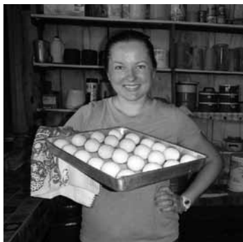
Siera bulciņas jeb pão de queijo gatavas!