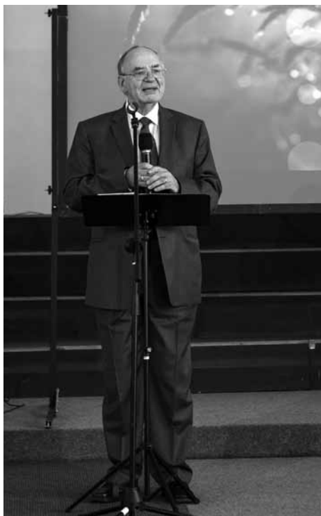
Sveiciens LBDS Kongresam 2014 no ALBA