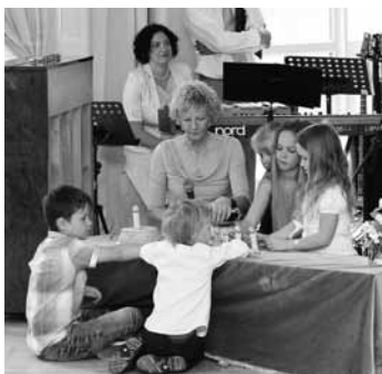
Evaņģēlija vēsts bērniem