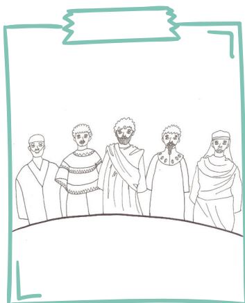
Viņi dzīvoja kā viena ģimene – kā brāļi un māsas. Viņiem viss bija kopīgs.