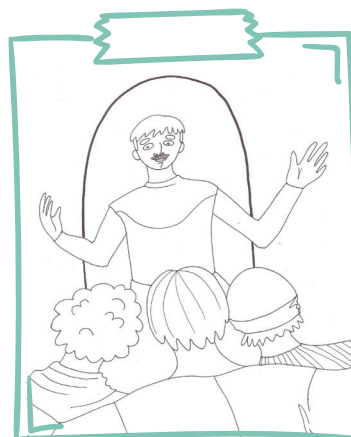
Viņu dzīves bija kā laba liecība par Dievu un Dieva darbiem. Dievs pievienoja viņiem vēl un vēl vairāk cilvēku.