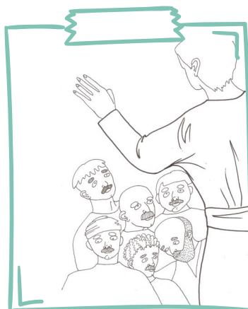
Tie, kas bija saņēmuši Svēto Garu, drosmīgi turpināja liecināt par Jēzu.

Labās ziņas par Jēzu kā uguns dzirkstelītes izplatījās tālāk uz tuvējiem ciemiem, pilsētām, citām valstīm un kontinentiem.