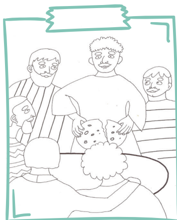
Kristieši priecājās pulcēties kopā – templī un arī mājās. Viņi kopā ēda, lūdza, sarunājās, slavēja Dievu.