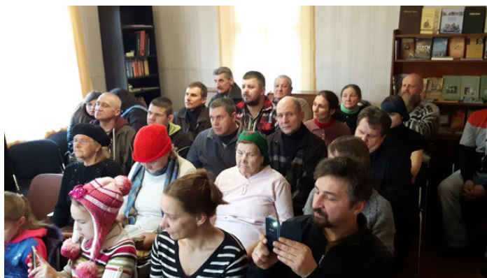
Atklāšanas dievkalpojums Zilupes Lūgšanu namā

pašai dziedību ir sācis Bībeles stundas Zilupē un uzņēmies rūpes par telpām. Šī gada laikā ir nojaukts senāk dedzinātais un izdemolētais Evaņģēlija nams, atbrīvojot pamatu jaunai ēkai. Blakus esošā dzīvojamā māja ir sakārtota tā, lai tajā varētu pulcēties cilvēki.