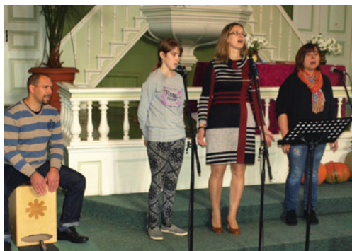
Ciānas draudzē slavēšanā iesaistījušies jauni cilvēki

“Apmēram gadu tikāmies ar BPI SĀC draudžu izvērtēšanas komandu. Ierosme nāca no pašiem draudzes locekļiem. Draudzes cilvēkiem bija iespēja izteikties, un tas bija ļoti svarīgi un svētīgi. Tālāk noformējās komanda, kas mēģināja noteikt mērķi un līdzekļus tā sasniegšanai. Apzinājāmies savus resursus un iespējas, lai reāli varētu saprast, ko tad īsti mēs spējam "pacelt". Tagad soli pa solim mēģinām iet uz priekšu. Mācāmies viens otru saprast un pareizi komunicēt, uzņemties atbildību. Mācāmies redzēt labās lietas un padarīt vēl labākas, visu pakārtot izvirzītajiem mērķiem, izdarīt kaut vienu lietu, bet labi, nevis daudz kaut kā...”