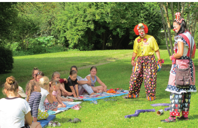
Arī bērniem sava nodarbība

Bija arī radošās darbnīcas, kurās darinājām sirsniņas no diegiem, gleznojām ar dabas materiālu palīdzību, uzzinājām savu personības tipu, ieklausījāmies vecmāmiņu stāstos, locījām stieplītes, veidojot skaistas rotas, kā arī apguvām pareizus