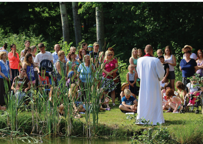
Kristību dievkalpojums Pelču nometnē