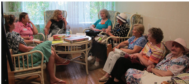
Interesu grupa vecmāmiņām

Otrā diena bija bagāta ar lekcijām un radošajiem darbiem. Klausījāmies Kristīnes Ēces lekciju par mūsu vērtību, bija piemēri par personībām