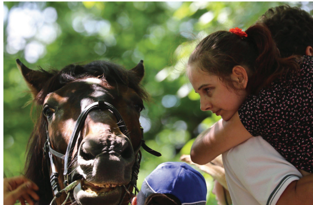
Pat zirgam prieks

un cenas, ieslēdzu savu cilvēcisko domāšanu un sapratu, ka ar mūsu materiālajām iespējām šis variants atkrīt. Bet Dieva domas nav mūsu domas. Dažas dienas vēlāk saņēmām aizkustinošu pateicības vēstuli par to, ko mēs darām, no viesnīcas darbinieces, kura pati ir māmiņa bērnam ar īpašām vajadzībām. Skrundas muižas īpašnieki ziedoja savas telpas un apkalpošanu bez maksas. Par pusdienām summa bija samazināta līdz minimumam, ko nosedza mūsu draugi no Vācijas.