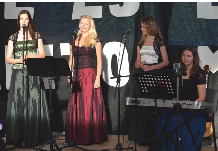
Exodus in Venia - Talsu dziedošās sievietes

Nometne ir tik īpaša! Šoreiz sēžam nevis solu rindās, bet gan pie galdiņiem, kas skaisti noformēti, katrs savā krāsā. Tur varējām dalīties savās pārdomās, diskutēt vai vienkārši būt kopā Kristus mīlestībā un klausīties.