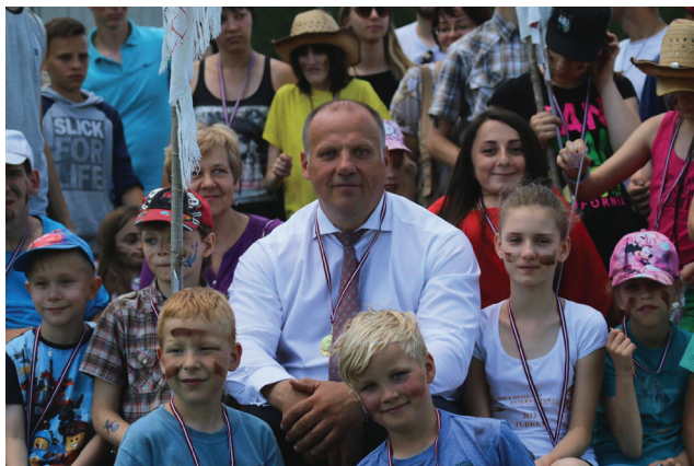
Ministrs Raimonds Bergmanis ar bērniem

Nometne noslēgusies, bet man šķiet, ka atrodos vēl svētlaimes debesīs. Nevaru beigt domāt par Dieva lielajiem darbiem. Kā katru reizi izvērtējot padarīto, saprotam, ka ir bijušas dažas kļūdas organizēšanas procesā, kas nākamajā reizē jāņem vērā, bet tie ir tikai nieki Mūžības priekšā.