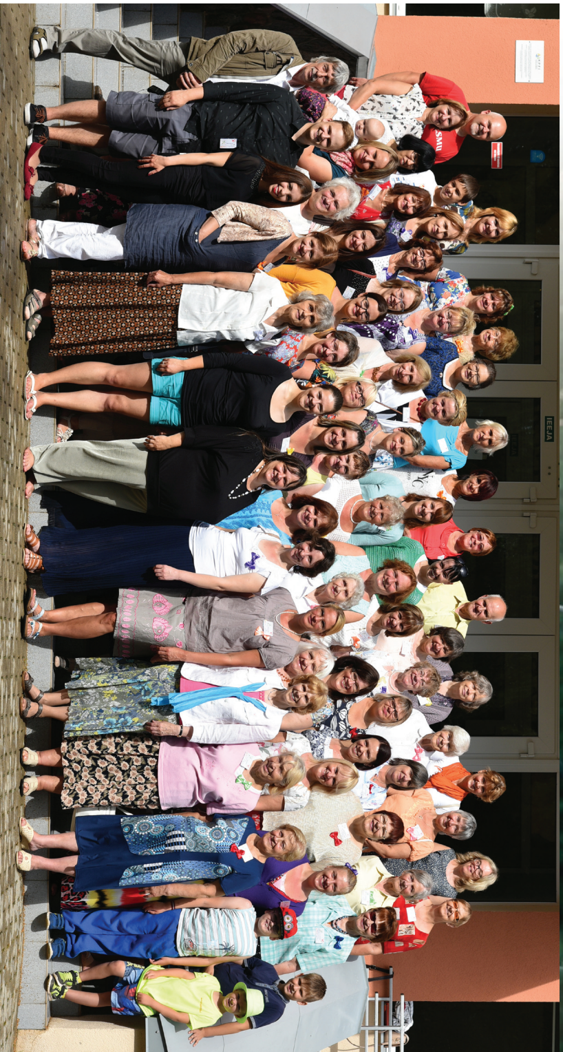
Nometne "TE ES ESMU, LIETO MANĻ" Laidze. Rakstu lasiet 16. lpp.