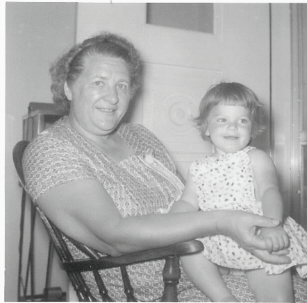
Ketlīna ar savu vecmāmiņu

Neesi pārsteigta par to, ko tavi mazbērni saka vai dara. Atceries, šie ir tie cilvēki, par kuriem tu brīdināji savus bērnus, sakot: “Es ceru, ka tad,