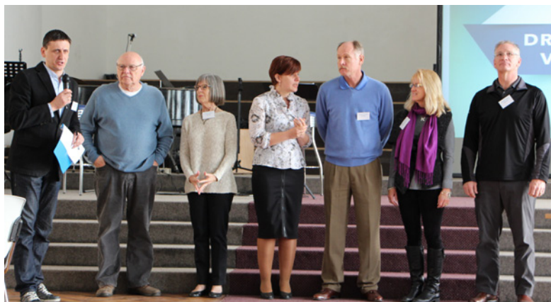
Semināra „Draudzes vadīšanas” lektori

Kopaina veidojas, kad draudzes vadības rezultātā ir skaidri noformulēta misija un redzējums.