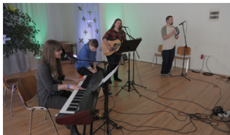
Dziedātājas Britnijas Kristiānas koncerts

Kā jau katru gadu, festivāls pulcināja jauniešus no dažādām Latvijas pilsētām. Tā kā katru gadu tas norisinās citā vietā, tad šajā reizē priecīgi varēja būt kurzemnieki, ko pamanījām arī festivāla apmeklētāju pulkā – plaši pārstāvēta bija tieši šī Latvijas puse. Neskatoties uz to, ka attiecību tēma – gaidīšana līdz seksuālajām attiecībām laulībā varētu šķist kādām vecuma grupām aktuālāka nekā citām, pasākumā bija novērojama plaša vecuma amplitūda, un pusaudži līdzās jau pieaugušiem jauniešiem itin viegli varēja atrast to, kas interesē gan vieniem, gan otriem. Pasākumā bija iespēja apmeklēt arī izvēles lekcijas, kad priekšroku varēja dot tām tēmām, kas izraisīja lielāku interesi vai šķita tuvākas sirdij.