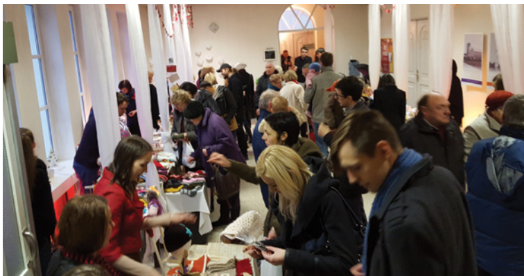
Tirdziņa kņada.

Āgenskalna draudzē šādi labdarības pasākumi notiek divreiz gadā – ziemā ir Sirdstirdziņš, bet vasarā – Dārza svētki. Pateicoties cilvēku dāsnībai un vēlmei dot, ir izveidots sociālās palīdzības kalpošanas fonds, un ar tā līdzekļiem iespējams palīdzēt tiem, kuri pēkšņi nonākuši finansiālās vai kādās citās grūtībās.