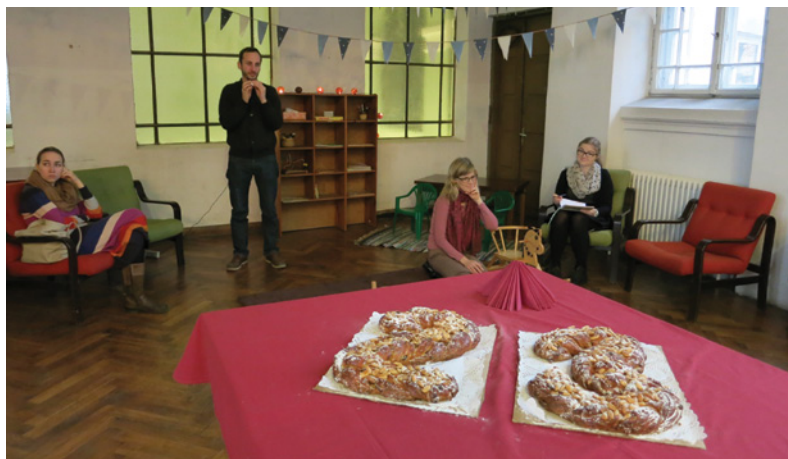
Svētku kliņģeris bija ļoti garšs

Paldies mīļajiem viesiem par svētku bagātināšanu, paldies ikkatram Semināra draudzes loceklim par uzticīgo kalpošanu draudzē. Vislielākais paldies Dievam, ka Viņš jau tik daudz gadus ir rūpējies, lai pašā Rīgas centrā būtu vieta, kur cilvēki var atrast savas garīgās mājas.