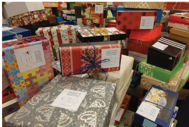
Dāvanas ceļo pie bērniem

Jā, visticamāk, nākamajā rudenī atkal notiks akcija „Zvaigzne austrumos” #kurpjukaste. Ja nākamajā gadā pirsiet kurpes, tad iesaiņojuma kasti neatstāriet veikalā!