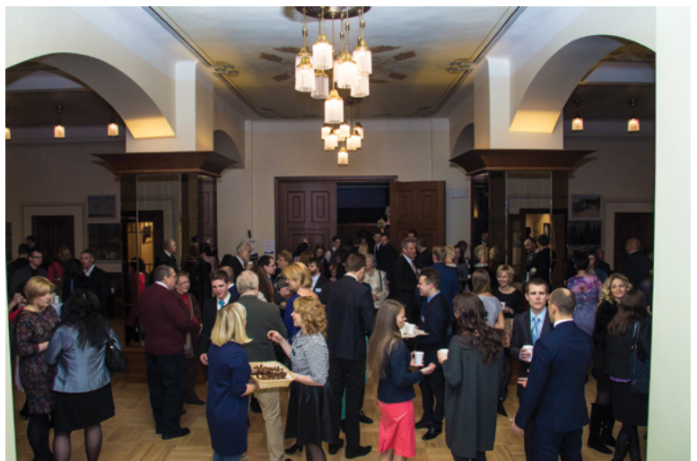
Pateicības Vakariņu viesu ierašanās

Absolventi kā pateicību BPI un LBDS darbiniekiem bija sagatavojuši no koka izgremtu Latvijas karti ar vārdiem: “Lielas lietas vēl notiks šeit; lielas lietas vēl jāpaveic šajā tautā,” simboliski turpinot pasākumu caurvijošo tēmu par mūsu atbildību Dieva priekšā par šo laiku un vietu.