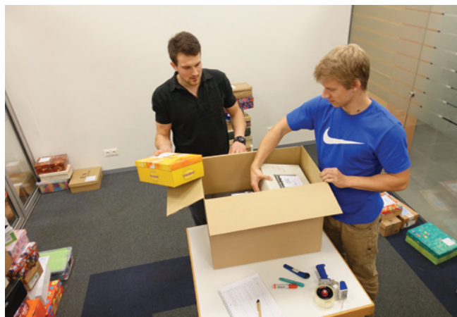
Kurpju kastes tiek rūpīgi iesaiņotas lielākās kastēs transportēšanai