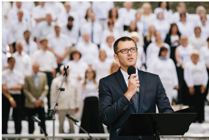
LBDS bīskaps Pēteris Sproģis

nebūtu vērtīgi paņemt). Koncertā vairs neizjūtu to saspringumu, kas saistīts ar pareizām vai nepareizām kustībām un notīm, ļaujot priekam dziedāt, priekam būt kopā. Ļaujot Dieva spēkam un mīlestībai, kas sajūtama pat fiziski, klausoties Ilzes Balodes diriģēto vīru kora dziesmu „Svēts ir”. Klausos un domāju, cik vareni tā skanētu Otrajos Dziesmu svētkos, kur korī bija ap 800 vīru. Bet dziesmas varenumu nevar izmērīt vīru skaitā, tas mērāms siržu ticības un uzticības lielumā, kas to dzied, un nav svarīgi – 8 vai 80, vai pat 800. Koncertā skan dažādu paaudžu, dažādu tautību komponistu darbi, bet vienojošā ir pateicība Dievam par Viņa mīlestību un žēlastību, par Viņa brīnuma darbiem,