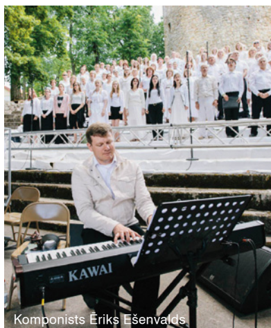
Komponists Ēriks Ešenvalds

Dziesmu svētki mums visiem apliecināja, ka, kalpojot kopā, varam paveikt daudz Dieva valstības darbā. Lūkojoties uz nākamajiem Dziesmu svētkiem, atcerēsimies, cik liela nozīme ir nepalikāt tikai savas draudzes dzīves aktualitāšu risināšanā, bet būt atsaucīgiem mūsu kopdarba dažādajām kalpošanas norisēm. Mums visiem jāstāv pretī šī brīža laikmetam, kas vēlas mūs attālināt citu no cita, fragmentēt un sadalīt. Domāju, tas ir mūsu lielākais uzdevums – redzēt, domāt un kalpot plašāk, un to darīt kopā. Dziesmu svētki „Dziesma Latvijas dvēselei” ir piemērs tam, ka mums tas var izdoties.