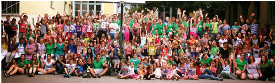
Angļu valodas nometnes dalībnieki Sentendrē (Szentendre), Ziemeļos no Budapeštas. Tajā piedalījās 140 bērni, 4 nodarbību vadītāji no Latvijas, 11 no ASV un 45 ungāru palīgi.

jādara kādam citam, bet sirdī mieru deva pārliecība, ka mūsu Aicinātājs ir uzticams un Viņš būs arī darītājs . Jo vairāk ieraudzīju savu nespēku, jo vairāk sapratu, cik ļoti svarīgi ir paļauties uz Jēzu, jo, ja Viņš tur nepagodināsies, tad nekam citam vairs nebūtu nozīmes. Noliekot visu pie Viņa