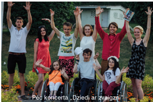
Pēc koncerta „Dziedi ar zvaigzni”