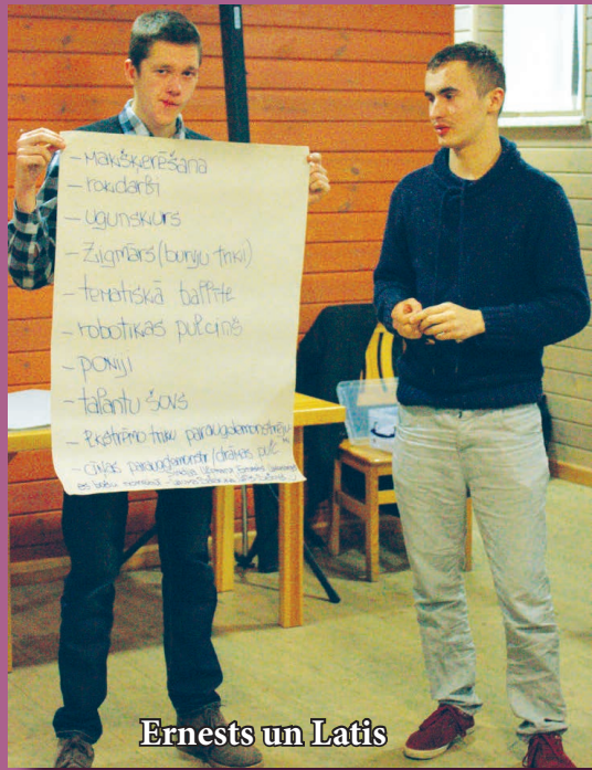
Ernestis un Latis