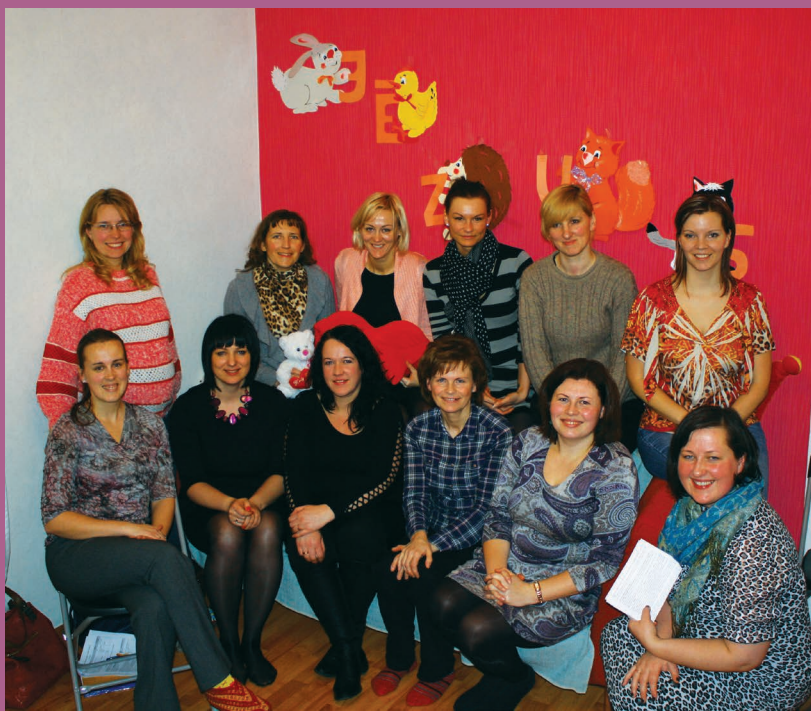
Par grupu "Laiks sievietēm" Talsos lasiet 13. lpp.