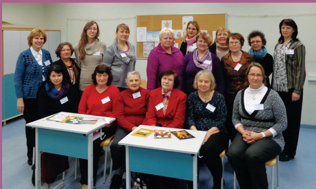
LBDS reģionālā tikšanās Cēsīs 22. februārī, Sieviešu darba nozare