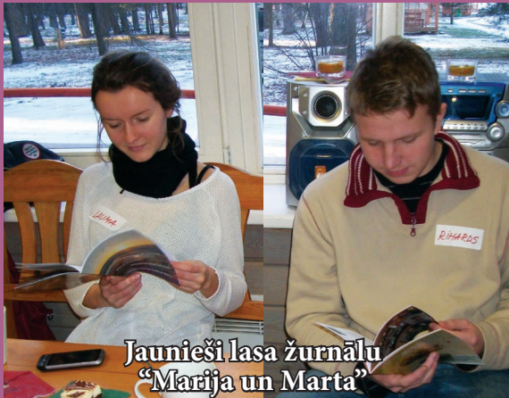
Jaunieši lasa žurnālu "Marija un Marta"