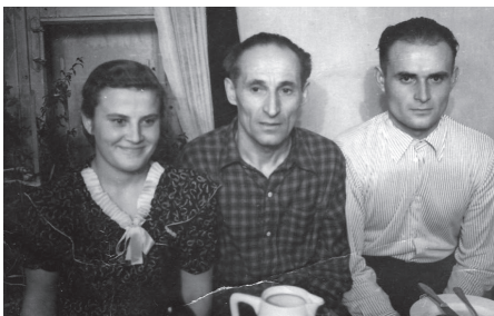
Apmeklējot tēvu Sibīrijā kopā ar brāli

Šī bija ļoti smaga ziema. Bet sestdienas vakaros pie mums pulcējās latvieši. Viena sieviete spēlēja vijoli un visi dziedāja. Baznīcas dziesmas mijās ar pašsacerētām un tautas dziesmām. Es neatceros, ka būtu kādreiz tik daudz dziedāts, kā tajā vissmagākajā trimdas ziemā. Varbūt tā vieglāk bija panest badu un pazemojumus. Šajā ziemā klusi mūžībā aizgāja divas māmuļas no mūsu istabas.