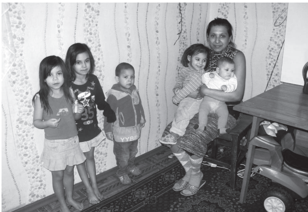
Viesos pie kādas ģimenes