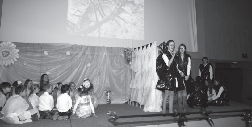
Svētdienskolas uzvedums Lieldienās

izmisušajiem cilvēkiem un sniedz atbalstu un iedrošinājumu. Nepieciešamās humānās palīdzības un pārtikas paku sniegšana tuvina cilvēkus Dieva vārda uzklaušanai un ticības stiprināšanai viņu sirdīs. Tieši izmisuma brīdī cilvēka sirds ir visatvērtākā Dievam. No 2013. gada draudzes locekļi aktīvi darbojas „zupas virtuvē,” kurā līdz 80 cilvēku 3 reizes nedēļā var saņemt siltu ēdienu. Lai arī motivācija apmeklēt šo virtuvi katram ir savādāka, ļaudis šo