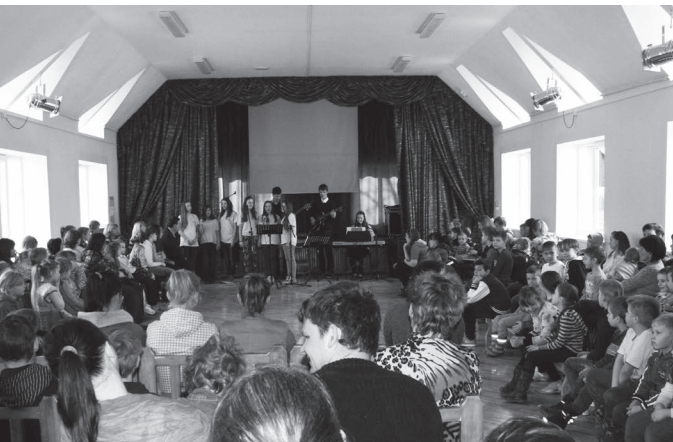
Pasākums "Vislielākā dāvana" Aknīstē

izdalīt dāvanas koncerta mazajiem apmeklētājiem. Pozitīvā attieksme pret šo akciju, ko draudze atbalsta un veic jau 12 gadus, dod bērniem drosmi stāstīt par Kristu ikdienā gan skolā, gan ārpus tās. Katru gadu šī akcija iepriecina 500 - 800 bērnus un viņu vecākus Viesītē un tuvākos novados: Aknīstes, Jaunjelgavas, Salas, Neretas.