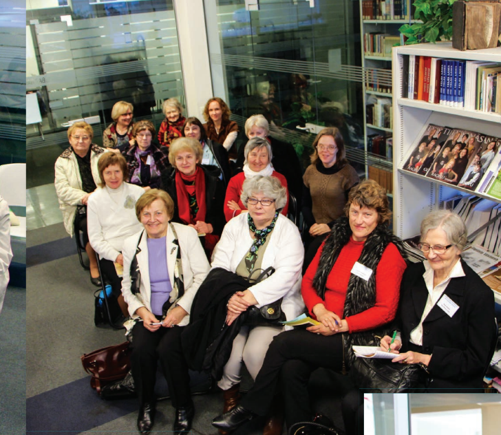
Savienības nama foajē