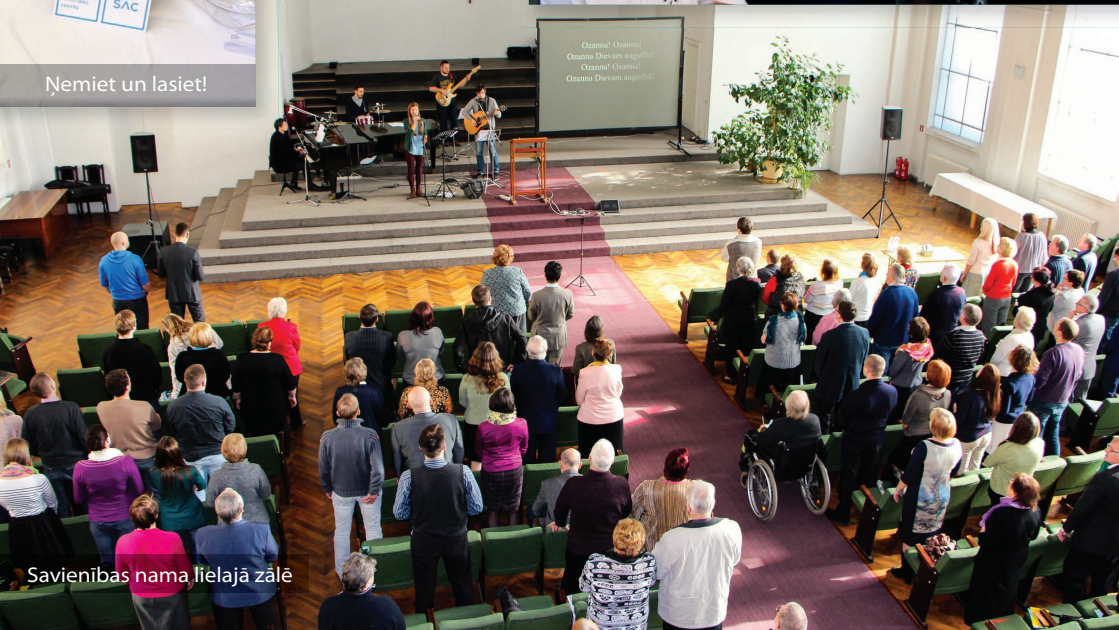
Savienības nama lielajā zālē