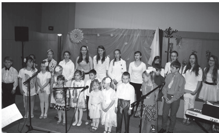
Svētdienskolas uzvedums Lieldienās

Produktīva sadarbība ir izveidojusies ar Viesītes sociālo dienestu. Cilvēkiem nepieciešams ne vien garīgais, bet arī materiālais atbalsts. Mūsu draudzes mācītājs un sieviešu kalpošanas apvienības māsas labprāt tiekas ar