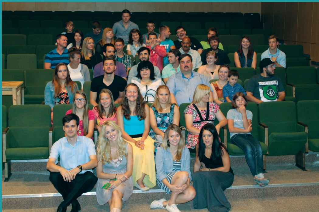
Angļu valodas nometne jauniešiem

KĀ PĒC UGUNSGRĒKA VIESĪTES DRAUDZE IZIET SABIEDRĪBĀ