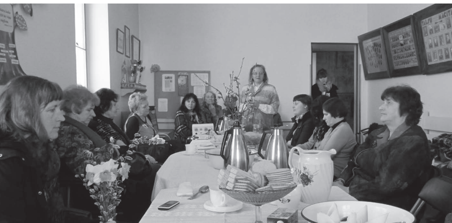
Sadraudzība Talsu konferencē

SKA padome pārrunājusi un centusies saprast tās vajadzības, kas šobrīd