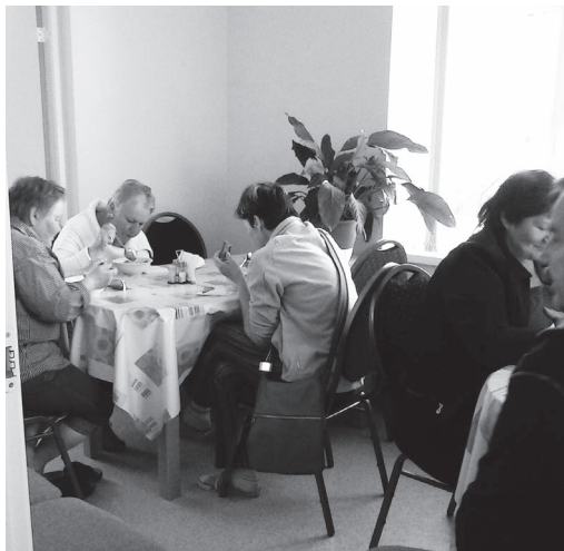
Zupas virtuve Viesītē