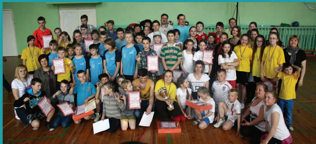
Svētdienskolas sporta diena