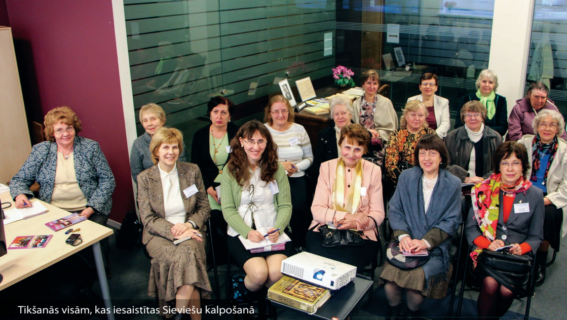
Tikšanās visām, kas iesaistītas Sieviešu kalpošanā