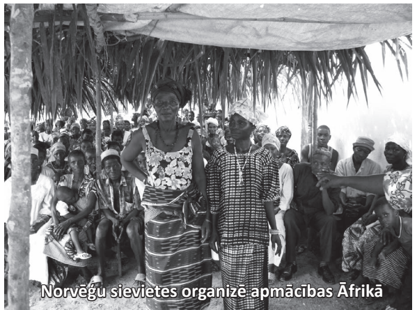
Norvēģu sievietes organizē apmācības Āfrikā

vairākas šīs tradīcijas veicējas ir pārtraukušas to darīt.