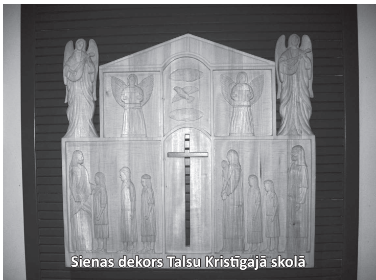
Sienas dekors Talsu Kristīgajā skolā

Labi sapratu, ka slimības dēļ mans bērns nebūs tāds, kā pārējie, ka viņai nebūs tādas nākotnes iespējas dzīvot un mācīties kā veseliem bērniem. Atcerējos