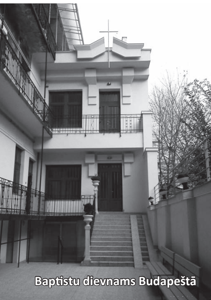
Baptistu dievnams Budapeštā