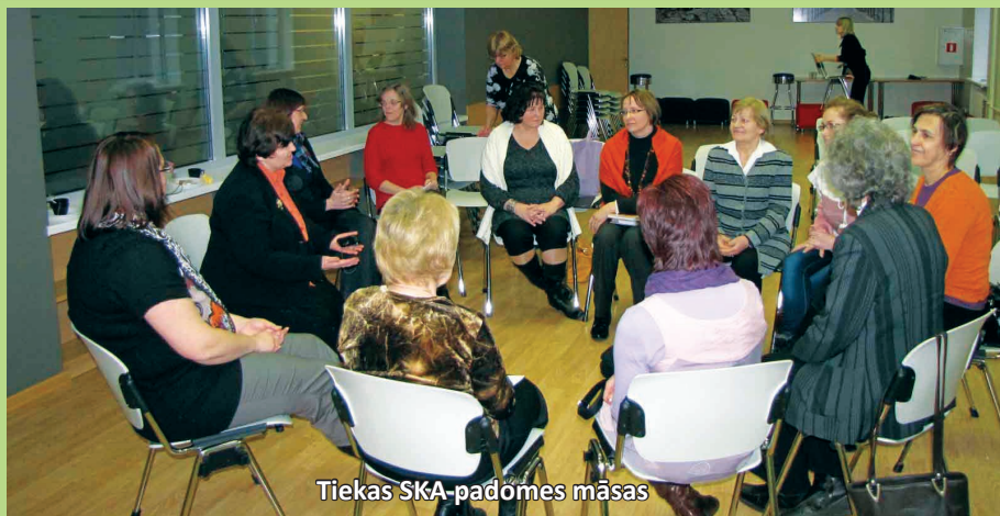
Tiekas SKA-padomes māsas