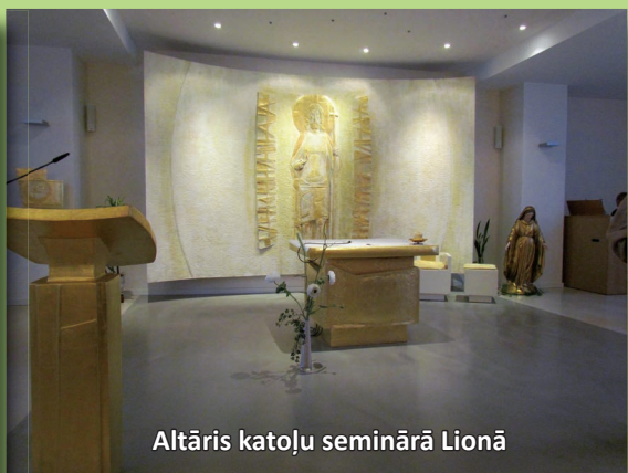
Altāris katoļu seminārā Lionā