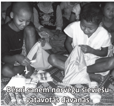
Bērni saņem norvēģu sieviešu gatavotās dāvanas

vairākas šīs tradīcijas veicējas ir pārtraukušas to darīt.