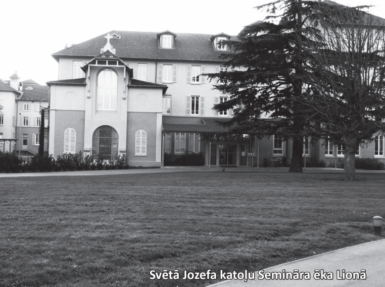
Svētā Jozefa katoļu Semināra ēka Lionā

Trīs dienu ilga pasākums notika Svētā Jozefa katoļu semināra telpās, kas izcēlās ar ērtām istabiņām, labi ierīkotām konferenču zālēm un skaistu parku apkārt ēkai.