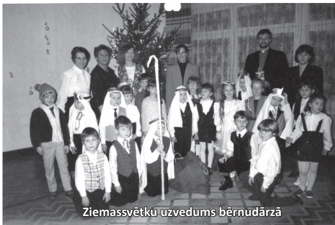
Ziemassvētku uzvedums bērnodrāzā

Kāds tēvs man stāstīja gadījumam: „Skolotāj, jūs mūsu ģimenē esat pamatīgu sajukumu izraisījusi. Svinējām dzimšanas dienu, galdā bija arī kādi stiprāki dzērieni. Pienāca mūsu dēls un jūsu mācības iespaidā paņēma no galda pudeli, pasludino - jums nebūs apreibināties, jo no tā ceļas tikai ļaunums. Mēs bijām apjukuši kopā ar viesiem, bet bērns ir jārespektē un skolotājas autoritāti nedrīkst graut. Tā nu viesības palika bez stiprajiem dzērieniem.” MM