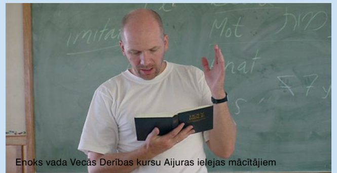
Enoks vada Vecās Derības kursu Aijuras ielejas mācītājiem