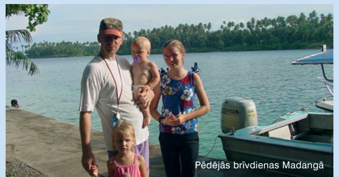
Pēdējās brīvdienas Madangā