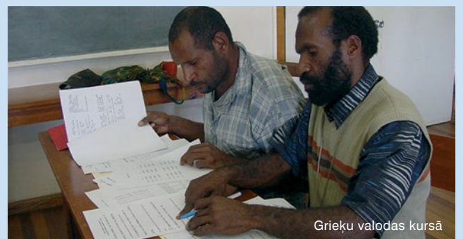
Grieķu valodas kursā