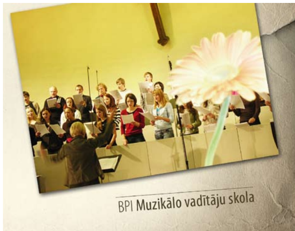
BPI Muzikālo vadītāju skola