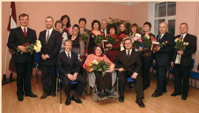
Teoloģijas semināra absolventi ar pasniedzējiem.

24. novembrī Kristīgās vadības koledžas telpās notika LBDS Teoloģijas semināra studiju programmas 8. izlaidums ar 17 absolventiem. Kopš 1994. gada tas bija otrs lielākais izlaidums, atšķirīgs no iepriekšējiem izlaidumiem arī ar to, ka šo programmu absolvēja 5 kristieši no citām Latvijas konfesijām.