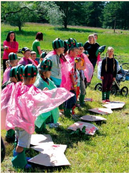
Mazie Kristus kareivji.