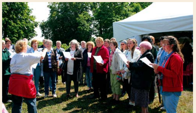
Jāņu celmlaužu koris.