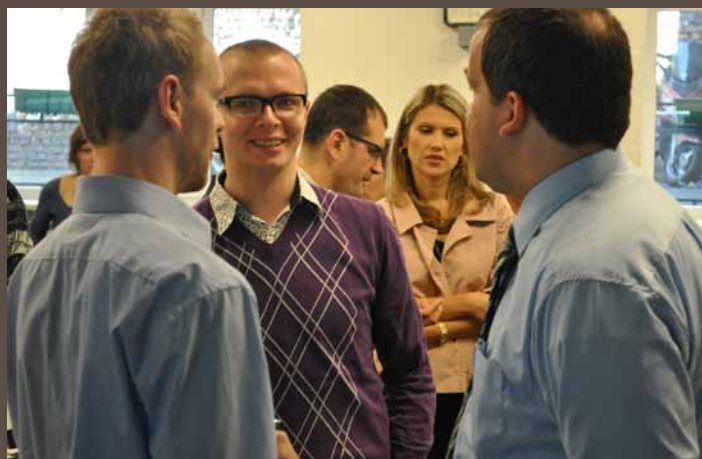
Lekcijas dalībnieki pārrunā Dr. Lillbaka sacīto

Kad mēs nošķiram baznīcu no valsts, mums jāizprot Latvijas Republikas Satversmes 99. pantā teiktais, ka baznīca ir atdalīta no valsts . Vai kā baznīcu uztveram tikai kristiešus vai arī dzan jūdus un musulmaņus? Ir jādefinē, ko īsti šajā kontekstā nozīmē vārds baznīca . Tāpat ir jāapzinās, kā mēs uztveram vārdu atdalīta . Ir iespējama gan naidīga nošķiršanās no valsts, gan draudzīga nošķiršanās. Brīvība publiskajā telpā nozīmē to, ka neviens tev nedrīkst teikt: „Nerunā, tu esi kristietis!”, kā arī neviens nedrīkst norādīt: „Nerunā, tu esi ateists!”, jo publiskā telpa pieder visiem vienādā mērā. Vārda brīvība nozīmē, ka varu