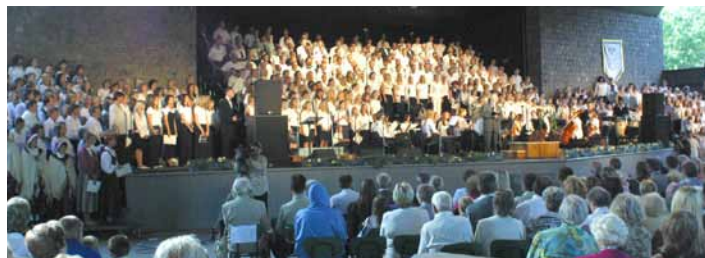
Dziesmu svētku koris Liepājā 2005. gadā

Sestdienas vakarā, 28. augustā plkst. 18:00 Ventspils Olimpiskā centra basketbola hallē svinēsim Latvijas baptistu 7. Dziesmu svētku koncertu. Gatavosimies un lūgšim, lai šie svētki ir stiprinājums katram, kas sevi apzinās kā daļu no Dieva ģimenes, un lai šis ir brīdis, kad Dievs caur dziedātājiem un sludinātājiem runā uz tiem ļaudīm, kuri būs nākuši klausīties dziesmas. Lūgšim, lai Dievs sagatavo dziedātājus un mūziķus būt atvērtiem tam, kā Dievs viņus gribēs lietot, lai aizsniegtu ventspilniekus un citus svētku viesus!