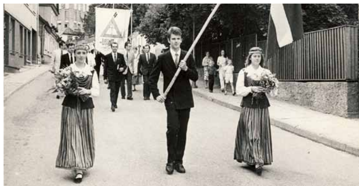
Dziesmu svētku gājiens 1992. gadā Talsos