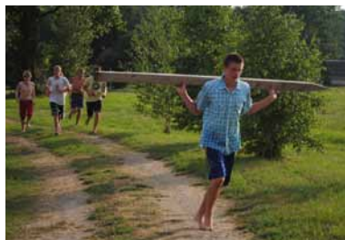
Izturības diena, kas noslēdzās ar izturības skrējieni