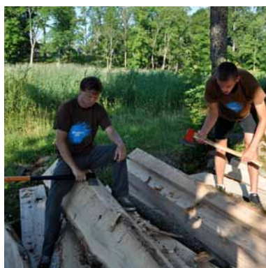
Dalībnieki prakses laikā ne tikai liecināja ar vārdiem, bet arī ar darbiem