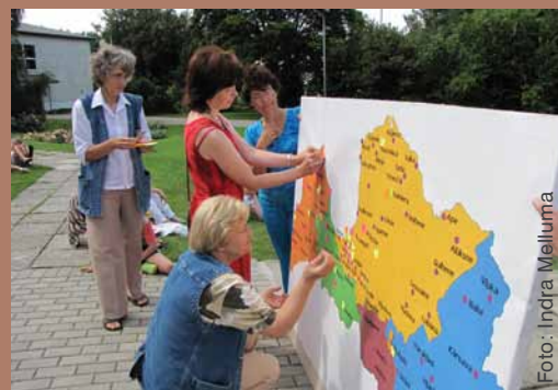
Nometnes dalībnieces piestiprina taureņiņus Latvijas kartē, tādā veidā atzīmējot draudzi, kuru pārstāv

Svētdien pulcējamies uz svētbriņi. Pēc brokastīm tikām aicinātas uz 19 lūgšanu stacijām. Tur bija lūgšanu stacijas par ģimenēm, draugiem, draudzi, Latviju, dzimto pilsētu, trūkcūcietējiem, politiķiem, LBDS, slimajiem un citiem. Tur bija arī lūgšanu stacijas – pateicības. Tur bija sajūtams tāds fantastisks Dieva tuvums, ka, to atceroties, acis pildās asarām un sirds ietriecas. Tas bija neapraķstāms skats – pie katras stacijas kāds nokritis ceļos, kādi apskāvušies, kopā lūdzot, kāds pateicībā noliecis galvu. Rakstījām arī Dievam katra savu lūgšanu un nolikām to pie krusta. Tāds fantastisks Dieva tuvums! Atceroties šo brīdi, saprotu, ka mūsu skaistums ir Dieva dāvana.