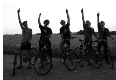
Prakses laikā Vērgalē tika izmantoti arī velosipēdi

Dievam. Mēs ceram, ka pēc dažiem gadiem, kad šie puīši pieaugs, viņi būs gatavi pārņemt stafeti. Paldies Dievam, ka ir sūfītie, kas ir gatavi nest gaismu pasaulei un uzņemties atbildību par sevi un citiem.