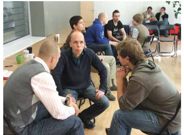
Dalībnieku diskusijas grupās

Sestdien, 9. oktobrī Baltijas Pastorālajā institūtā notika Atvērto durvju diena "VAJADŽĪGI VĪRI, KAS UZDRĪKSTAS PAKLAUSĪT". Atvērto durvju dienas mērķis bija palīdzēt LBDS draudžu brāļiem izprast garīgās kalpošanas būtību, skaidrāk saprast savu aicinājumu uz šo kalpošanu un rosināt viņus uzsākt studijas BPI.