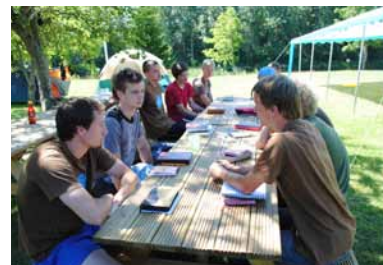
BPI DRAFTS dalībnieki gatavojas praksei