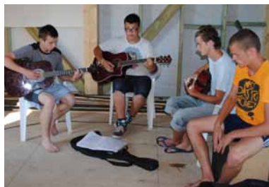
Katru rītu un vakaru dalībnieki piedalījās kopīgā pielūgsmē