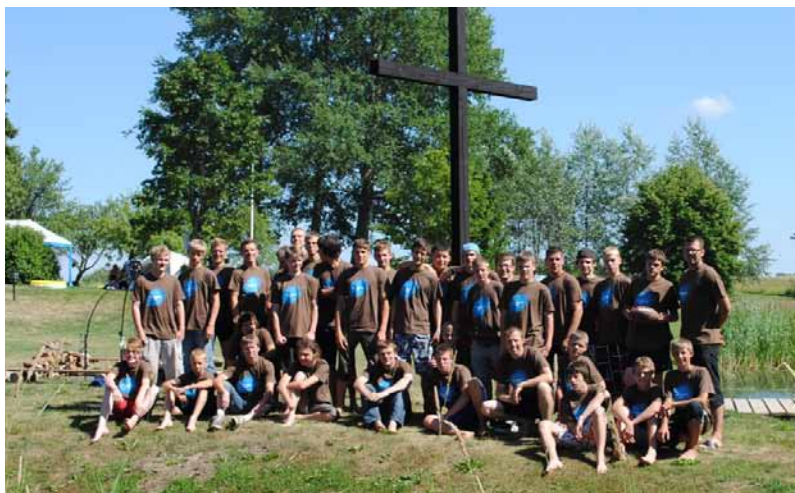
Visi BPI DRAFTS 1. līmeņa nometnes dalībnieki

Abās šajās nometnēs varēja redzēt puīšu nopietnību un vēlmi sekot Jēzum. Patīkami bija vērot šo puīšu ticību, nopietnību un izturību, kas stiprināja arī mūs, nometnes vadītājus. Īpašs prieks bija, ka 2. līmeņa dalībniekos varēja saskatīt pozitīvas pārmaiņas, kas ir notikušas gada garumā, un ka viņi ir kļuvuši nobriedušāki. Trīs no viņiem bija arī 1. līmeņa nometnes vadītāju vidū. Vēl jo vairāk tas ļauj ticēt, ka Latvijā aug jauni vīri, kas meklē Dieva aicinājumu un vēlas sekot tam. Jau tagad mēs redzam, ka mums ir jauna paaudze, kas ir gatava kalpot