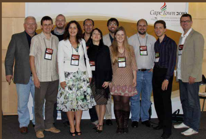
Visi Latvijas delegāti

vai ar šādu diagnozi viņš varēs būt mācītājs. Tagad viņš kalpo HIV un AIDS slimnieku vidū, ir precējies un viņam ir bērni. Domājot par mūsu valsti, man radās jautājums, vai mēs vispār ļaujam šādiem cilvēkiem ienākt baznīcā un būt tur? HIV var iegūt ne tikai seksuālās attiecībās, un, pat ja arī tas tā notiek, un cilvēks nāk pie Kristus, lai saņemtu mūžīgo dzīvību, vai viņš saņem mūsu pieņemšanu?