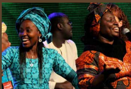
Cilvēki no dažādām tautām, zemēm un vietām kopīgi slavēja Dievu