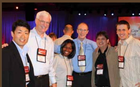
Mana diskusiju grupa

Es katru rītu sēdos pie viena diskusiju galda ar organizācijas “Jaunatne ar misiju” vadītāju no Indonēzijas, Japānas Baptistu draudžu apvienības vadītājiem, “World Vison” darbinieci no Ganas un Eiropas Bērnu kalpošanas vadītāju no Beļģijas – tik dažādi cilvēki bija pie katra no konferences galdiem. Dienas vidū dalībniekiem bija iespēja izvēlēties, vai piedalīties diskusijās vai noklausīties dialogus par aktuālām problēmām, piemēram, nacionālisms, nabadzība, ekoloģija, globalizācija, sieviešu līdzdalība kalpošanā, AIDS un HIV, mūsdienu verdzība u. c. Vakaros bija liecību laiks, un vienā no šādiem vakariem priekšā iznāca divi cilvēki, kuriem ir HIV vīruss. Vienam puisim tas tika konstatēts tad, kad viņš tikko bija pabeidzis savas teoloģijas studijas un vēlējies kļūt par mācītāju. Pirmais jautājums viņam bija, kā viņš šo vīrusu ieguvis, un otrs –